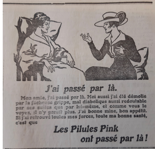
Figure 2 : la publicité en faveur des Pilules Pink pour le traitement de la grippe. Journal Les Alpes, 1918, Archives municipales d'Annecy