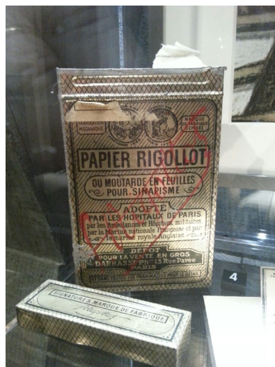
Figure 4 : une boîte de Sinapisme Rigollot exposée au Mémorial de Verdun 51 .