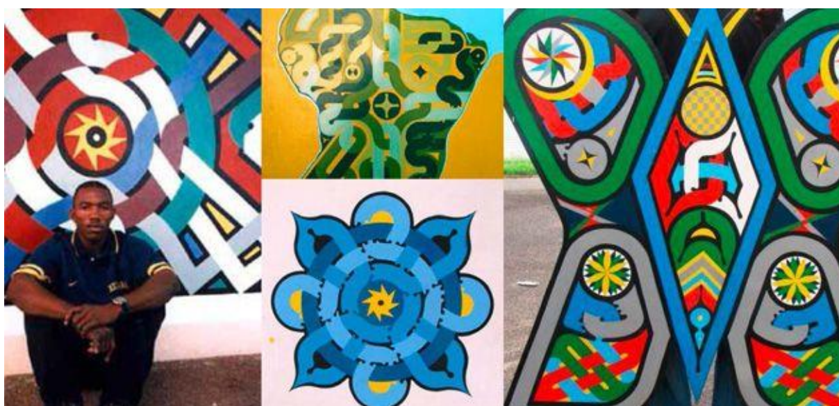
Fig. 2 : Exemple d'art pictural Tembé.

Dans Arts primitifs ; regards civilisés 1 , Sally Price écrit au sujet de ces sociétés que face à un objet, il faut « retrouver l'usage et le sens qu'il avait dans sa société d'origine » (13). Les masques, sculptures, tableaux (art tembé) des Marrons de Guyane, témoignent précisément de la pertinence du terme « héritage ». Non seulement, ces peuples en ont conservé la mémoire, mais ils ont aussi perpétué la tradition.