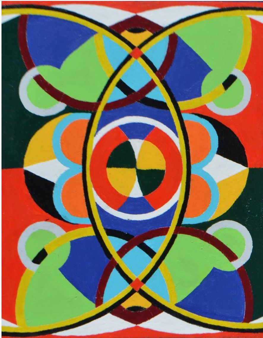
Fig. 4 : Peinture sur toile tombé.