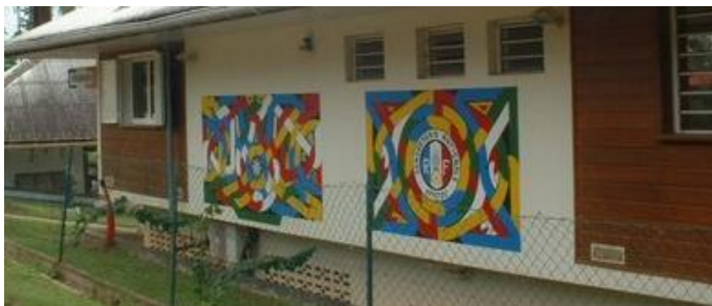
Figure 1: Art temé. Peinture murale au collège III de Saint-Laurent du Maroni.

Le sens caché de ces peintures murales n'est accessible qu'aux initiés et aux artistes qui l'ont composée. De fait, la sémiologie doit s'emparer de cette dimension de l'œuvre, pour tenter d'en cerner l'orientation et surtout la signification première.