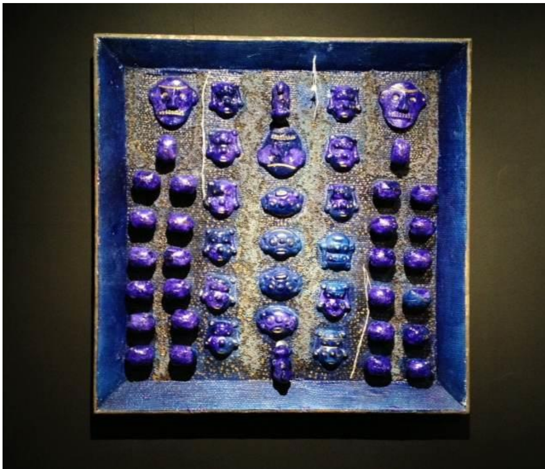
Fig. 3 : Tray de Victor Anicet.

Cette convergence entre symbolique ancestrale et poétique contemporaine montre bien, comme le fait également Victor Anicet avec ses trays, que l'art caribéen es profondément attaché à ses racines, et qu'il n'a pour autant, rien de primitif.