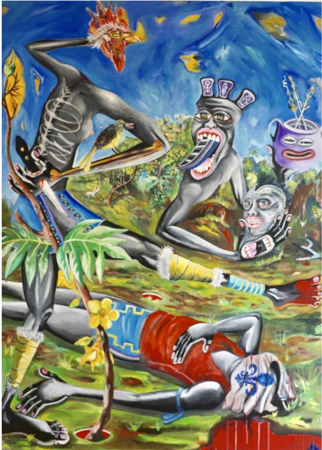
Fig. 1 : Ronald Cyrille dit, B. Bird, Tribute, acrylique sur toile, 200 x 138 cm, 2016.