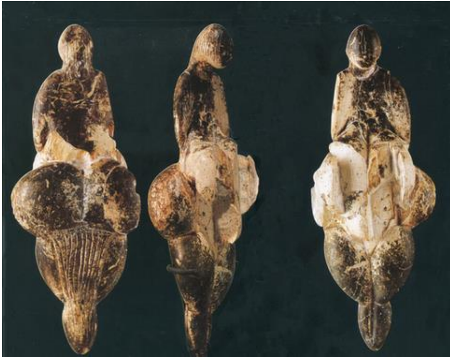
Fig. 3 : Vénus de Lespugue

En revanche, la deuxième, plus centrée sur la classification des œuvres selon des critères esthétiques les aborde forcément de manière plus statique et « réceptive ». Il n'y pas lieu, de notre point de vue, de mettre en concurrence ces deux manières de percevoir, recevoir et transmettre le sens du signe artistique.