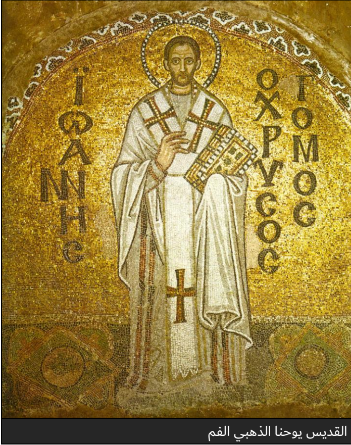
القديس يوحنا الذهبي الفم

المدينة وكتبها ثروةً من الأعمال الأدبية، بما في ذلك السجلات و التواريخ و الأطروحات اللاهوتية، التي أضاعت