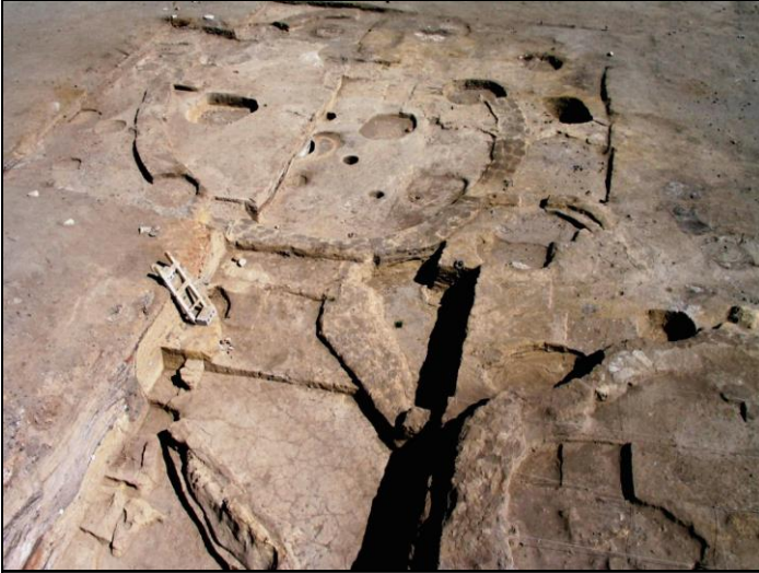
الهندسة المعمارية في بناء الأرض في تل أسود

زراعيةٍ صغيرةٍ خلال العصر الحجري الحديث. و مع تطور الزراعة و تدجين الحيوانات بشكلٍ كاملٍ بحلول العام 5000 قبل الميلاد في الغوطة، تطورت القرية لتصبح مدينةً متواضعةً.