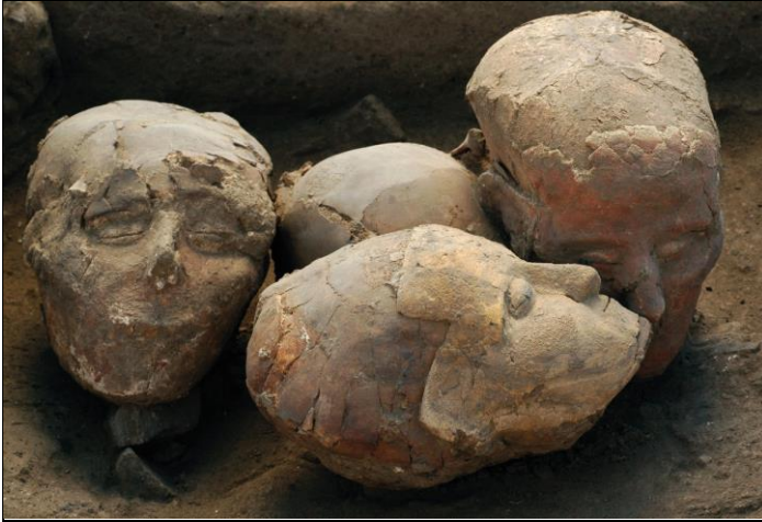
جماجم مغطاة بالجبص من موقع تل أسود

من خلال القطع الأثرية التي يعود بعضها إلى الأناضول و بلاد ما بين النهرين.