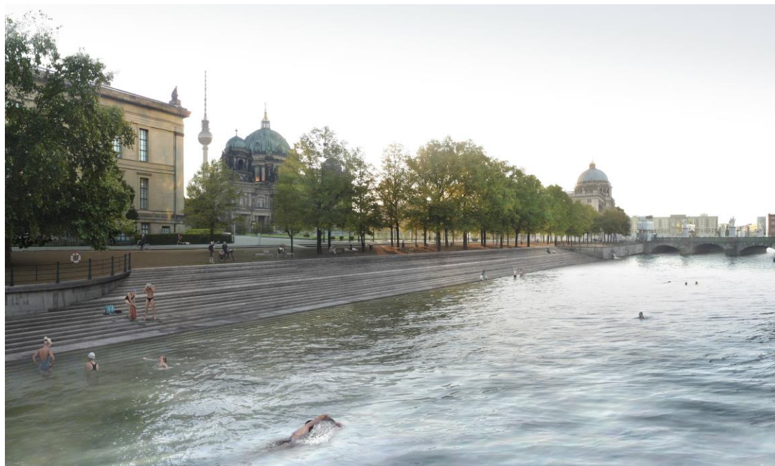
Figure 2. Un photomontage présentant le projet Flussbad Berlin, avec la rangée d'escaliers permettant d'accéder à la zone de baignade en contrebas du Humboldt Forum.