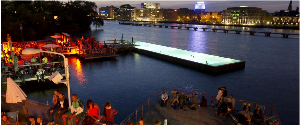
Figure 3. le "Badeschiff an der Arena", une piscine d'eau filtrée au-dessus de la Spree à Kreuzberg.