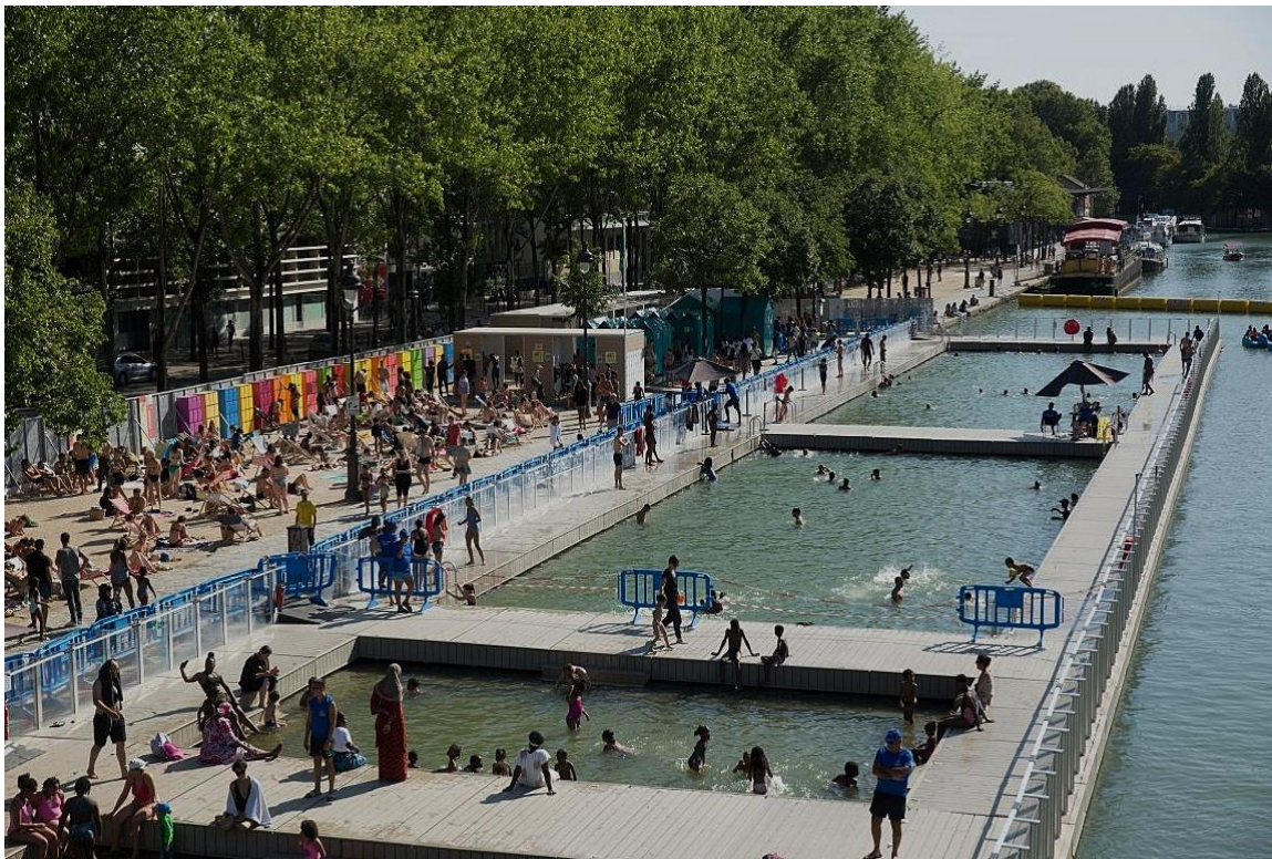
Figure 4. Le bassin de la Villette alimenté par le canal de l'Ourcq, site de baignade ouvert depuis l'été 2017, Paris.