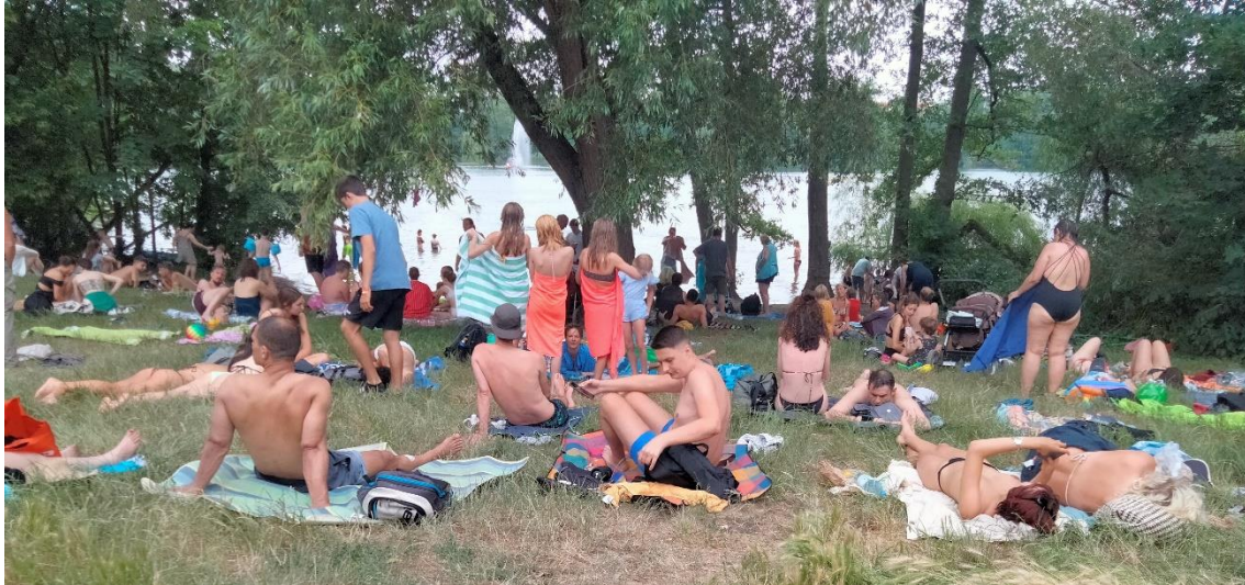
Figure 3. Exemple d'un « débordement » un jour de canicule : la baignade en dehors du site autorisé à Weissensee (Berlin), juin 2022.