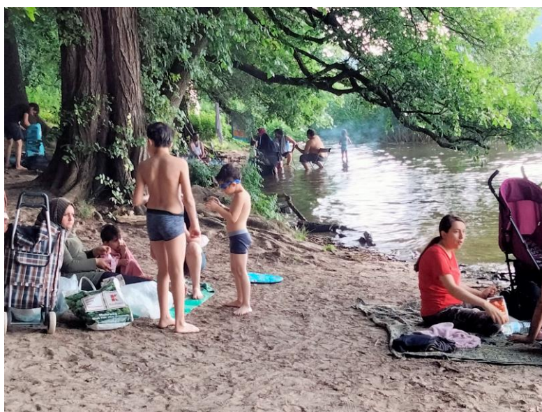
Figure 2 : Des usages diversifiés sur les sites de baignade au-delà de la mise à l'eau. Tegeler See. Crédits photo : Gaële Rouillé-Kielo, juillet 2021.

Dans un espace urbain qui associe densité et diversité 17 , le « moment baignade » est investi de différentes valeurs et représentations selon les personnes qui s'y adonnent. Cette diversité d'attentes sur un espace restreint constitue une première facette du défi de régulation que représente la baignade, comme le montrent des éléments d'enquête collectés à Berlin via des entretiens et des observations sur les sites autorisés ou non. En région francilienne, l'ouverture d'un site de baignade pourrait également venir concurrencer des usages existants sur des berges (à commencer par ceux considérés comme illégitimes). Ces réflexions permettent de discuter plus avant la notion de « public » (au singulier) utilisée pour désigner les usagers (actuels ou escomptés) des sites de baignade. On a bien affaire à des pratiques et à des attentes très diversifiées selon les groupes sociaux, les groupes d'âge et selon les (micro)territoires empreints d'urbanité que forment les sites de baignade en eau « naturelle ».