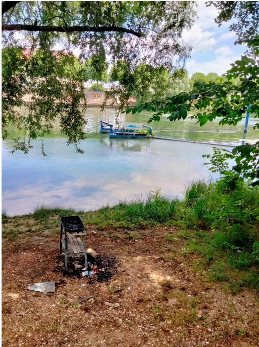
Figure 2. La grève à Ivry/Vitry-sur-Seine, un espace de liberté possiblement concurrencé par l'usage baignade ? Crédits : G. Rouillé-Kielo, juin 2022

D'autres participants soulignent l'importance de prendre en compte l'existence des usages actuels dans les futurs aménagements, notamment de la pêche et des barbecues (« il faut que personne ne soit exclu »).