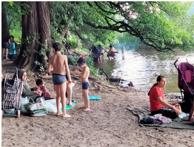
Figure 2 : Des usages diversifiés sur les sites de baignade au-delà de la mise à l'eau. Tegeler See. Crédits photo : Gaële Rouillé-Kielo, juillet 2021.

Dans un espace urbain qui associe densité et diversité 17 , le « moment baignade » est investi de différentes valeurs et représentations selon les personnes qui s'y adonnent. Cette diversité d'attentes sur un espace restreint constitue une première facette du défi de régulation que représente la baignade, comme le montrent des éléments d'enquête collectés à Berlin via des entretiens et des observations sur les sites autorisés ou non. En région francilienne, l'ouverture d'un site de baignade pourrait également venir concurrencer des usages existants sur des berges (à commencer par ceux considérés comme illégitimes). Ces réflexions permettent de discuter plus avant la notion de « public » (au singulier) utilisée pour désigner les usagers (actuels ou escomptés) des sites de baignade. On a bien affaire à des pratiques et à des attentes très diversifiées selon les groupes sociaux, les groupes d'âge et selon les (micro)territoires empreints d'urbanité que forment les sites de baignade en eau « naturelle ».