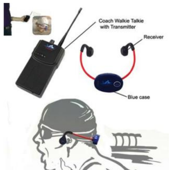
Figure 1. Schéma du dispositif des casques aquatiques à conduction osseuse