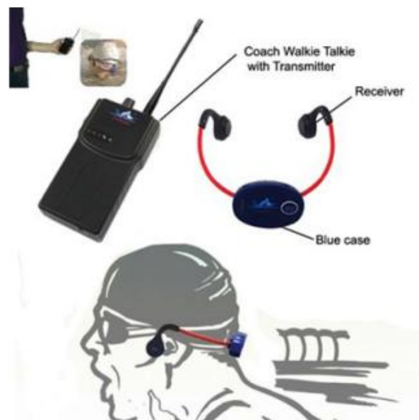
Figure 1. Schéma du dispositif des casques aquatiques à conduction osseuse