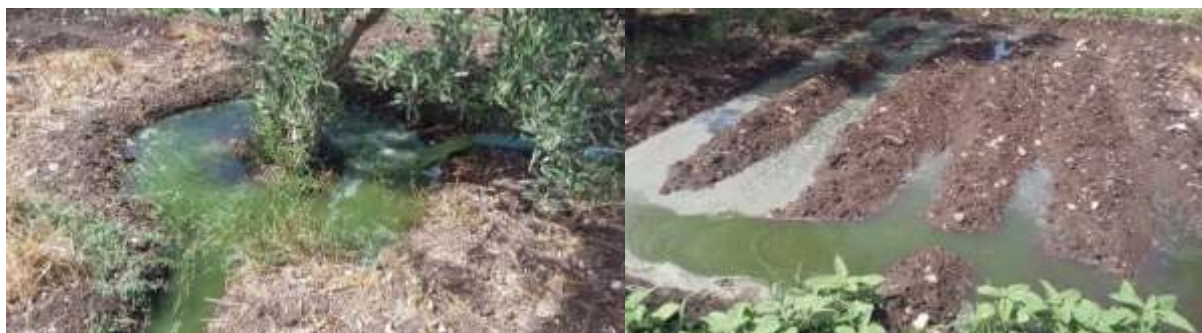
Photos 1. Irrigation en gravitaire d'oliviers et de maïs fourrager, à partir des effluents pompés à l'aide d'une motopompe

encore installée, c'est l'irrigation gravitaire qui est aujourd'hui utilisée par ces agriculteurs (cf. Photos 1). De grandes quantités d'eau sont lâchées et l'irrigation s'effectue en continu, toute la journée durant.