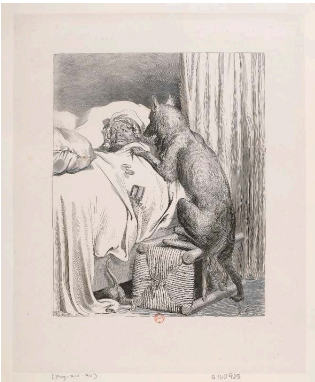
Fig. 2b. G. Doré ; F. Pannemaker sc., Le Petit Chaperon rouge , « Cela n'empêche pas qu'avec ses grandes dents il avait mangé une bonne grand'mère », 1861, gravure sur bois de bout, 24 x 19,3 cm. BnF Estampes, Dc-298 (J,2)-fol