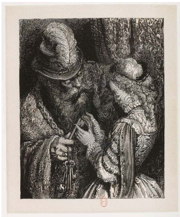
Fig. 5a. G. Doré ; H. Pisan, La Barbe bleue , « S'il vous arrive de l'ouvrir, il n'y a rien que vous ne deviez attendre de ma colère », 1861, gravure sur bois de bout, 24, 5 x 19,5 cm. BnF Réserve des livres rares, Rés Y2-179.