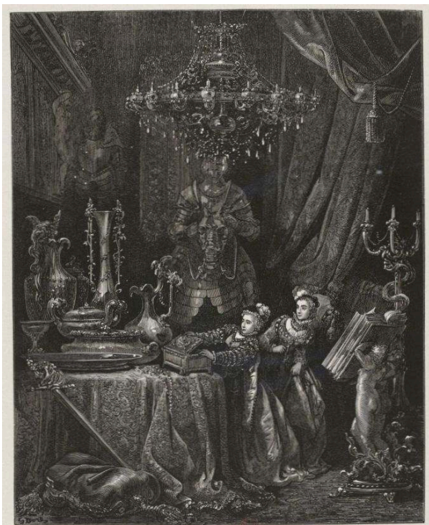
Fig. 5b. G. Doré ; H. Pisan, La Barbe bleue , « Les voisines et leurs amies... tant elles avaient d'impatience de voir toutes les richesses de sa maison », 1861, gravure sur bois de bout, 24,5 x 19,5 cm. BnF Réserve des livres rares, Rés Y2-179.