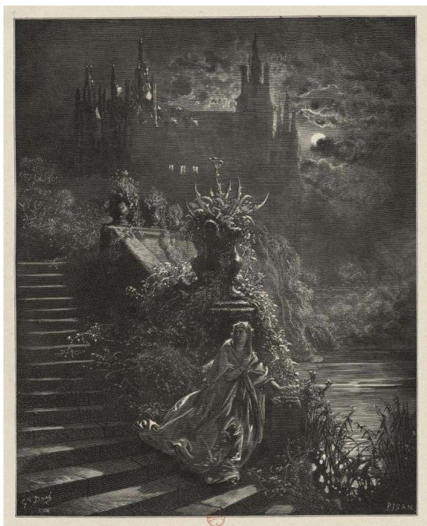
Fig. 4b. G. Doré ; H. Pisan, Peau d'Âne , « La jeune princesse, outrée d'une vive douleur, n'imagina rien autre chose que d'aller trouver la fée des Lilas, sa marraine », 1861, gravure sur bois de bout, 24,5 x 19,6 cm. BnF Estampes, Dc-298 (J,2)-fol.