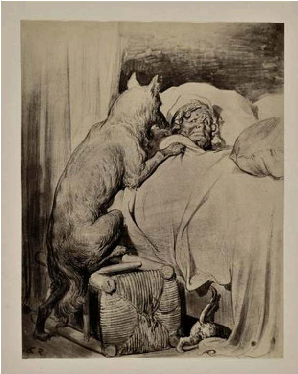
Fig. 2a. Nadar (?), Le Petit Chaperon rouge, « Cela n'empêche pas qu'avec ses grandes dents il avait mangé une bonne grand'mère », [1860], photographie d'un dessin de G. Doré, 24 x 19,3 cm. Musée d'Art Moderne et Contemporain de Strasbourg, Cabinet d'Art Graphique, inv. 55.992.13.233.