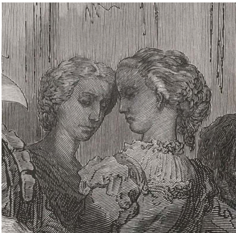
Fig. 3b. G. Doré ; H. Brevière sc., Cendrillon , « Approchant la pantoufle de son petit pied, il vit qu'elle y entrerait sans peine et qu'elle était juste comme de cire » (détail), 1861, gravure sur bois de bout. BnF Estampes, Dc-298 (J,2)-fol.