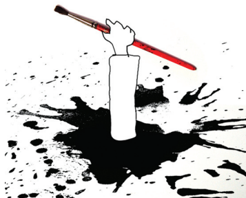
↑ Ill. Antonin Louchard.

13. Sapiro G., Rabot C. (dir.) (2016), Profession? Écrivain , Étude pour le MOTIF.