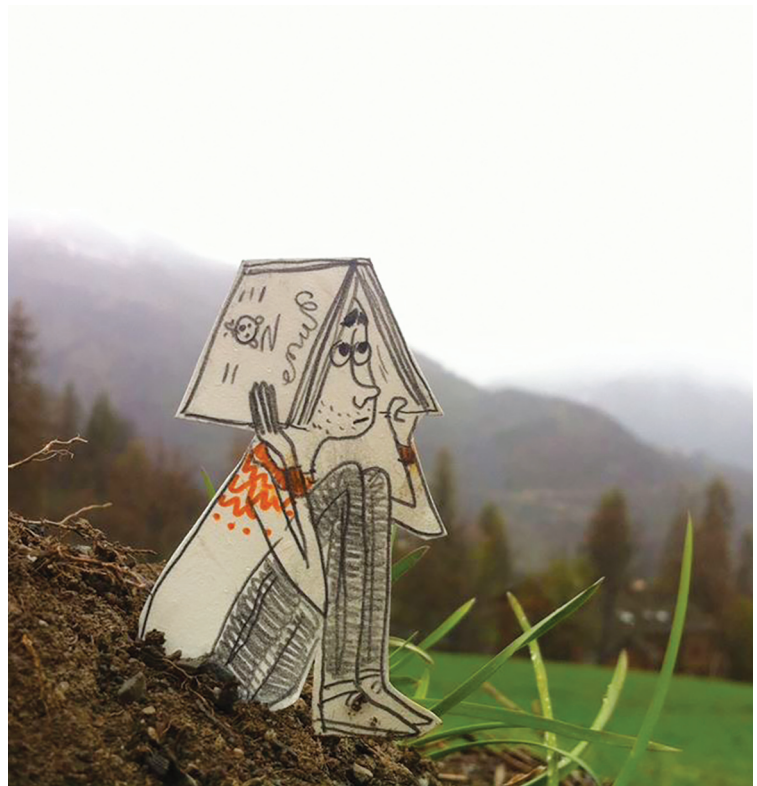
↑ Ill. Benjamin Chaud.

En économie, une première modalité d'action de la part des pouvoirs publics est le