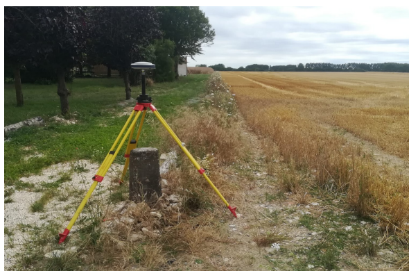
3 Mesure RTK de la position d'une borne du réseau RDF de l'IGN dans la zone de La Laigne par les équipes du LiENS en juillet 2023.