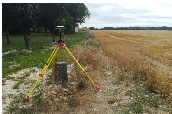
3 Mesure RTK de la position d'une borne du réseau RDF de l'IGN dans la zone de La Laigne par les équipes du LiENSs en juillet 2023.

C. Perrin, C. Sira et M. Métois pour la communauté Epos-France impliquées dans les missions post-sismiques.