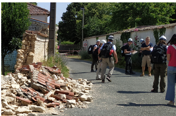
2 Evaluation de l'intensité macrosismique dans la commune de La Laigne par le Groupe d'intervention macrosismique.

Les réseaux de marqueurs historiques de l'IGN, dont la position et l'altitude sont mesurées lors de campagnes régulières, sont en revanche très denses dans la zone