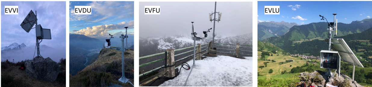
2- Station de mesures multi-paramètres co-localisées associant récepteur et antenne GNSS, station météorologique et capteur sismologique : exemple des station EVVI (Villelongue), EVDU (Sarrance), EVDU (Barèges) et EVLU (Lescun).