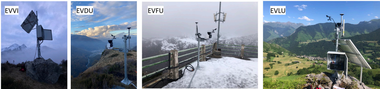
2- Station de mesures multi-paramètres co-localisées associant récepteur et antenne GNSS, station météorologique et capteur sismologique : exemple des stations EVVI (Villelongue), EVDU (Sarrance), EVFU (Barèges) et EVLU (Lescun).

Florian Bourcier (EOST), Maxime Bès de Berc (EOST), Jean-Philippe Malet (EOST), Maurin Vidal (Géoazur), Céleste Broucke (IPGP), Nicolas Chatelain (EOST), Franck Grimaud (OMP), Jean Lertort (OMP), Guy Sénéchal (LFC), Clément Hibert (EOST), Frédéric Masson (EOST), Lucie Rolland (GéoAzur)