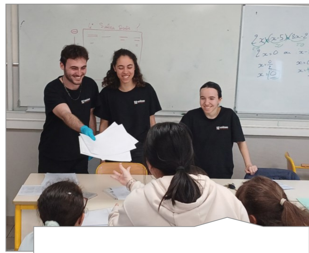
Travail de groupe

Cependant, des fortes iniquités persistent , et seront probablement accentuées avec l'arrivée des nouveaux outils technologiques telles que le numérique (Wolf, 2023).