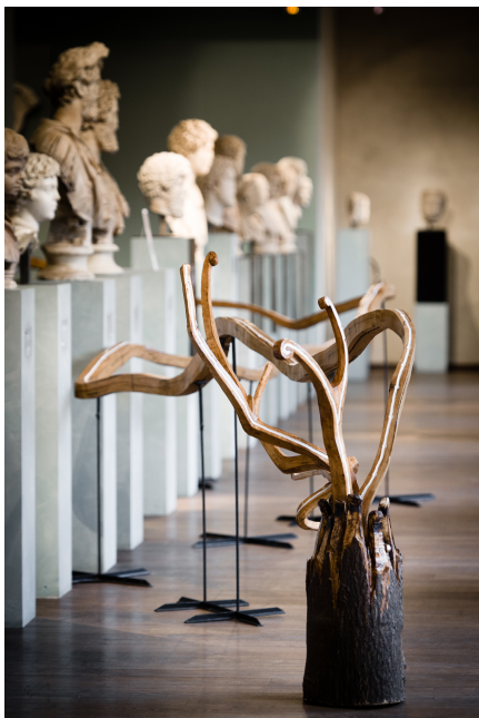
Fig. 5. Lachavanne David, La Branche du temps , 2012, bois, fer, 120 cm. de long., installée au Musée Saint-Raymond, Toulouse, 2012 et pour Domme Contemporaine, Dordogne, 2015.