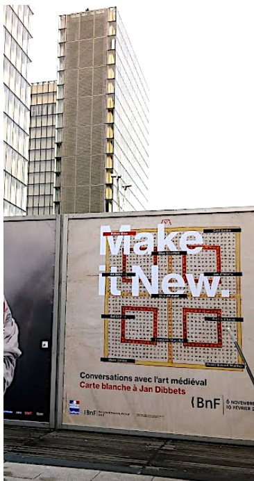
Fig. 8. a) Exposition « Make it New », BnF, 2018-2019. Vues de l'affiche devant le bâtiment