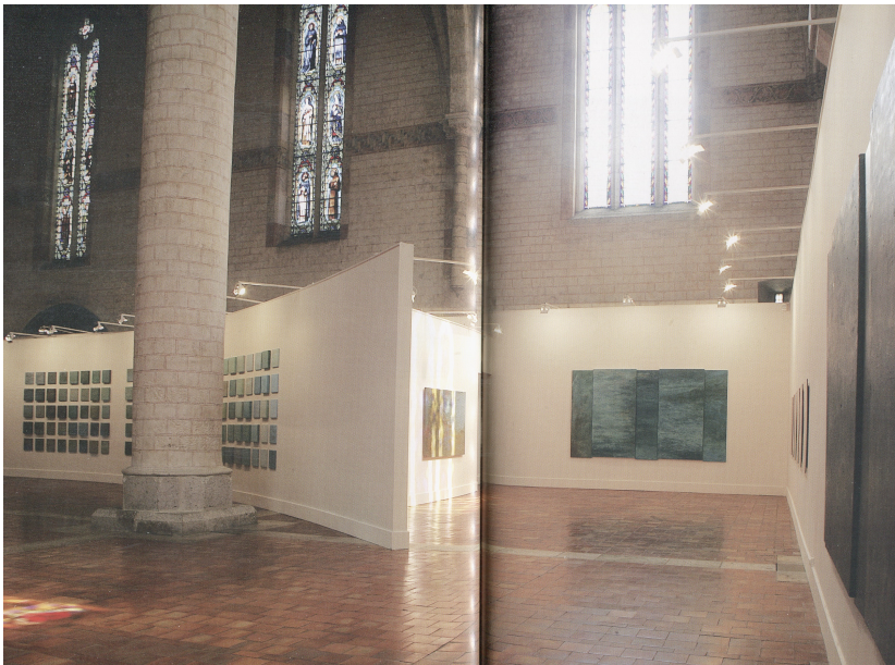
Fig. 4. Elshout Aart. Vue de l'exposition « Eloges de l'eau », Les Jacobins, Agen, 2013. Photo de Thierry-Daniel Vidal (Catalogue d'exposition, Aart Elshout, Eloges de l'eau . Eglise des Jacobins d'Agen, Ed. Musées d'Agen, 2013).