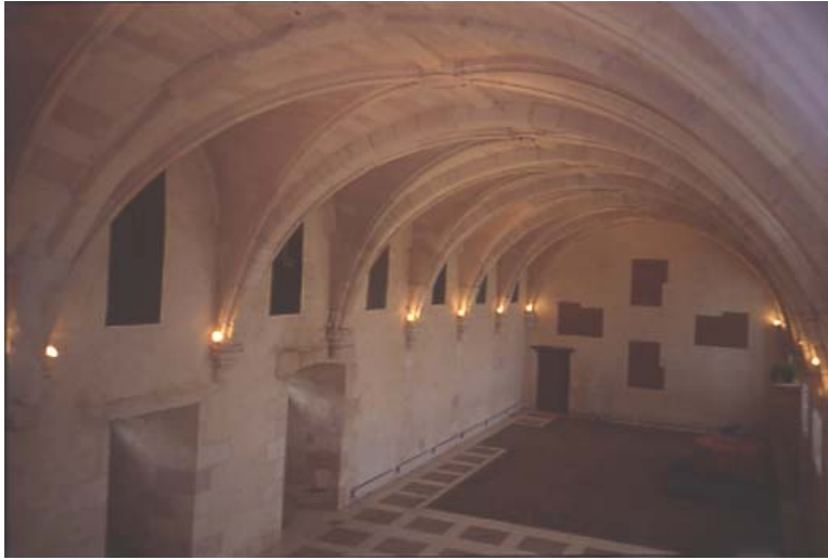
Fig. 1. Tremlett David. Vue de l'exposition de David Tremlett, Abbaye de Saint-Savin-sur-Gartempe, 1991. Photo de l'auteur.

Figures article de Régimbeau Gérard, « L'art contemporain sous influence médiévale : sémioses dans le patrimoine »