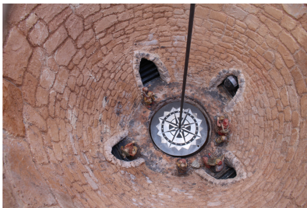
Fig. 6 a) et b). Lachavanne David, Va où le vent te mène , Sauveterre-de-Rouergue (12), Avril 2017. Œuvre participative, 300 cm x 150 cm. Fer, résine, zinc. Résidence artistique « Points de Repères/Repères de points ». Organisée par L'atelier blanc. Photos : a) Girouette, axe ; b) rose des vents, saynette en terre cuite dans le puits, vue en plongée.