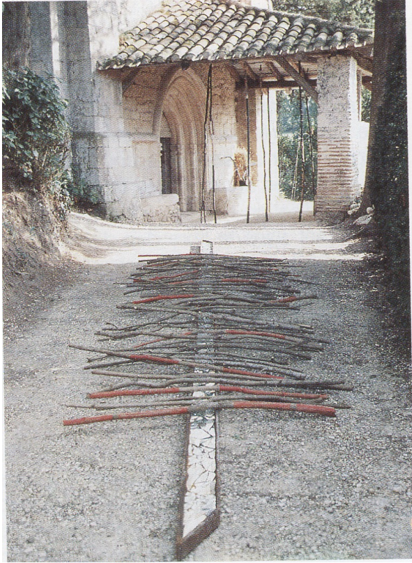
Fig. 3. AluMET, Installation pour « Plein champ », Saint-Jean-de-Balerm (47), extérieur, 1991, 120 cm.