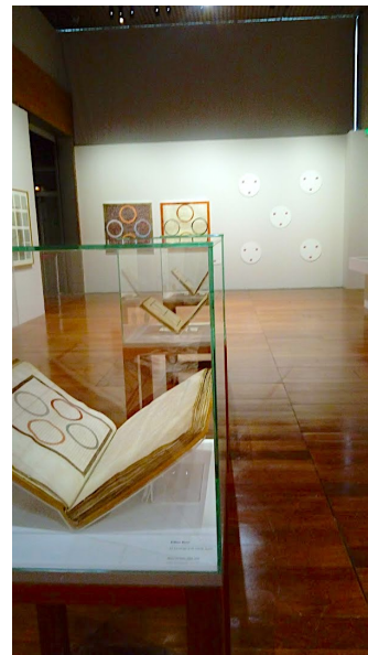
Fig. 8 b) Exposition BnF, Manuscrits au premier plan, manuscrits du Moyen Age, à l'arrière-plan, tableaux de Niele Toroni au mur et garndissemnt de pages de manuscrits.