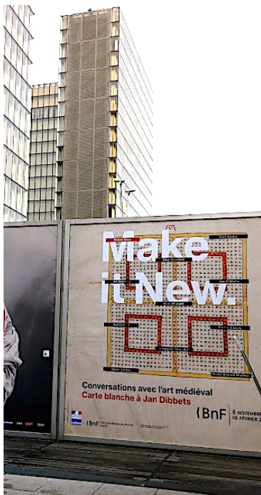
Fig. 8. a) Exposition « Make it New », BnF, 2018-2019. Vues de l'affiche devant le bâtiment