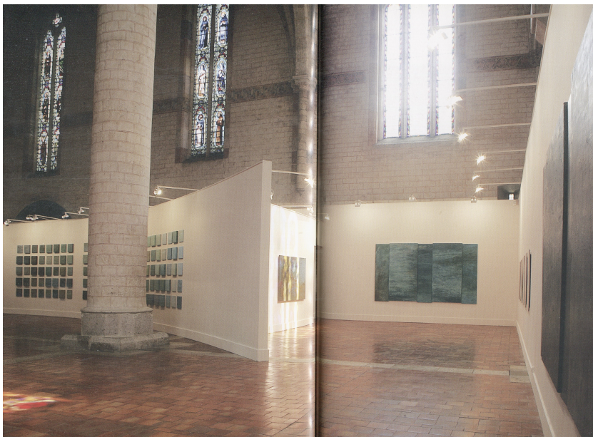
Fig. 4. Elshout Aart. Vue de l'exposition « Eloges de l'eau », Les Jacobins, Agen, 2013. Photo de Thierry-Daniel Vidal (Catalogue d'exposition, Aart Elshout, Eloges de l'eau . Eglise des Jacobins d'Agen, Ed. Musées d'Agen, 2013).