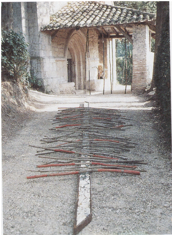
Fig. 3. Alu met, Installation pour « Plein champ », Saint-Jean-de-Balerm (47), extérieur, 1991, 120 cm.