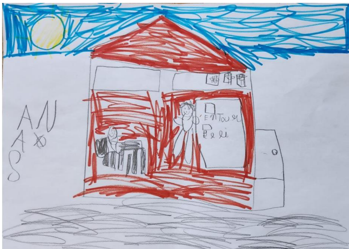
Fig.2 – Le dessin de Soan