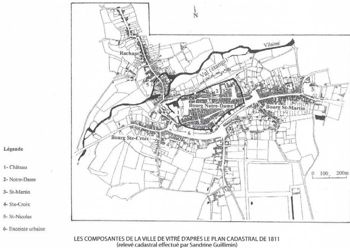
Fig. 1 – Vitré, les composantes de l'agglomérations d'après le cadastre de 1811