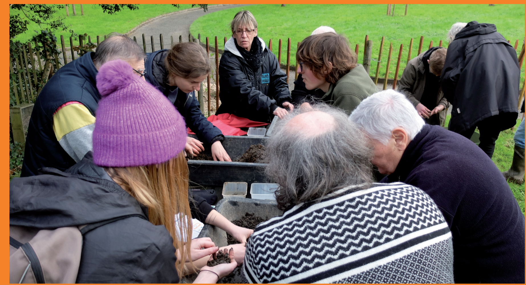
Tri des vers de terre avec les animateurs de l'Observatoire participatif des vers de terre, les jardiniers de la parcelle des dahlias du collectif Dignité cimetière, et avec les étudiantes du M2 ERPUR, au Jardin du bonheur à Maurepas