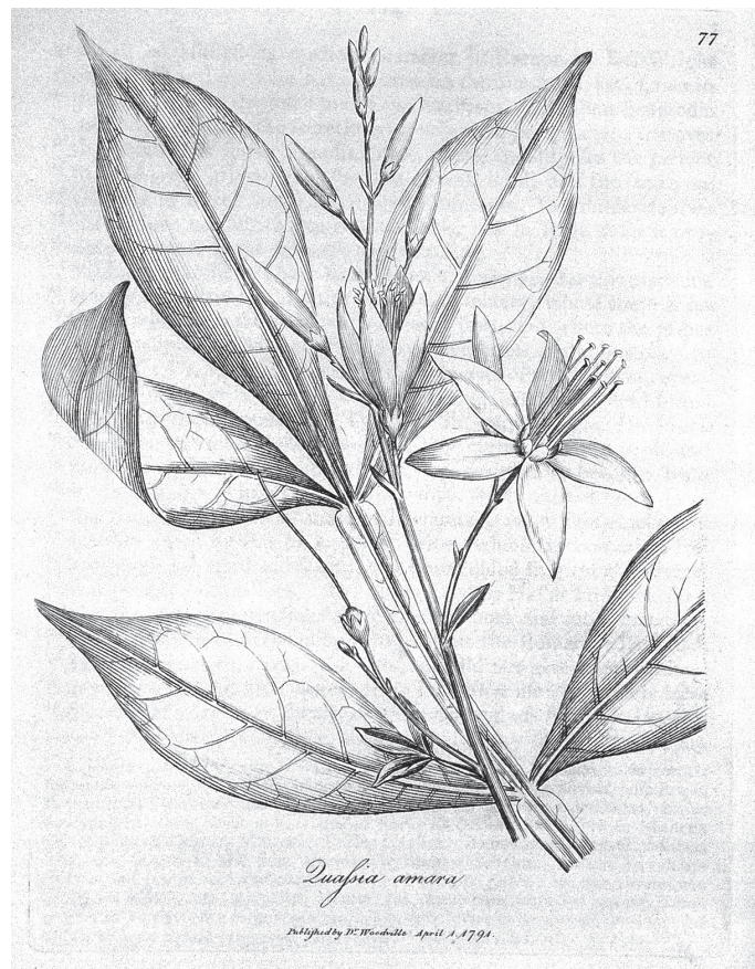
Quassia amara (Bitter Quassia) - illustration de William Woodville (1752 - 1805) pour son ouvrage "Medical Botany, Containing Systematic and General Descriptions, with Plates, of all the Medicinal Plants, Indigenous and Exotic, Comprehended in the Catalogues of the Materia Medica of 3; Volume 2", London, J. Philipps, 1790-94

Originaire d'Amérique Centrale, la distribution actuelle de Q. amara s'étend du Mexique au nord-est du Brésil, avec une plus forte densité entre le nord du Panama et le sud du Nicaragua. L'espèce est aujourd'hui naturalisée le long des rivières au Suriname, dans d'anciennes plantations en Guyane française, et cultivée dans les jardins des zones côtières du Guyana, du Suriname et de Guyane française.