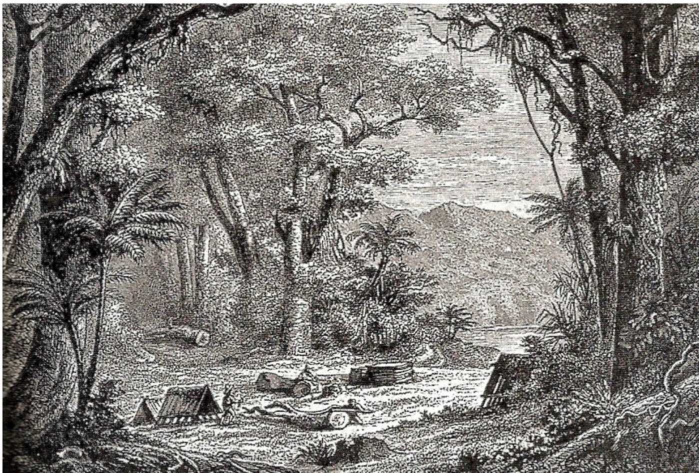
La récolte de l'écorce du quinquina vers 1730. (Auteur inconnu, Wellcome Library, Londres)

Une analyse approfondie des noms vernaculaires de cette espèce sur tout le continent américain a montré que les groupes de langue caraïbe sont les seuls peuples du bouclier guyanais à posséder leurs propres noms vernaculaires spécifiques (apekyi, apekii, pekeï, eripu, k'eripu, peunpe) qui ne sont pas dérivés des noms kwasi ou quina. Le seul nom vernaculaire uniquement vénézuélien (maipa) est également issu d'un groupe amérindien de langue caribe. La diversité des noms en langues caribes pour Q. amara peut ainsi être interprétée comme le signe d'une connaissance ancienne au sein de ces groupes originaires du nord-ouest de l'Amérique du Sud.