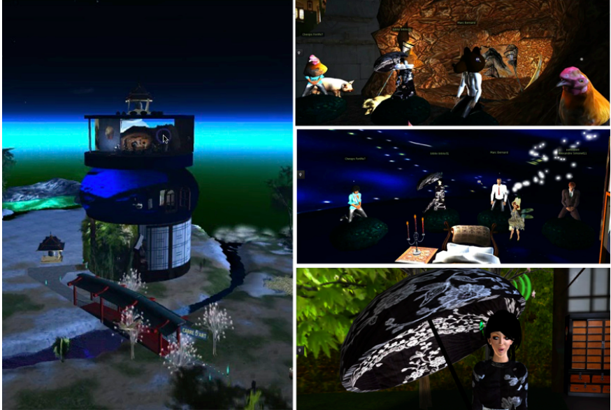
Figure 2. Les espaces dans l'auditorium virtuel

Trois scènes 3D sont construites et superposées dans un grand cylindre qui occulte le monde virtuel extérieur : un décor japonisant pour L'Éloge de l'ombre , la chambre de Wendy pour Peter Pan , une grotte pour La vision de la tanière .