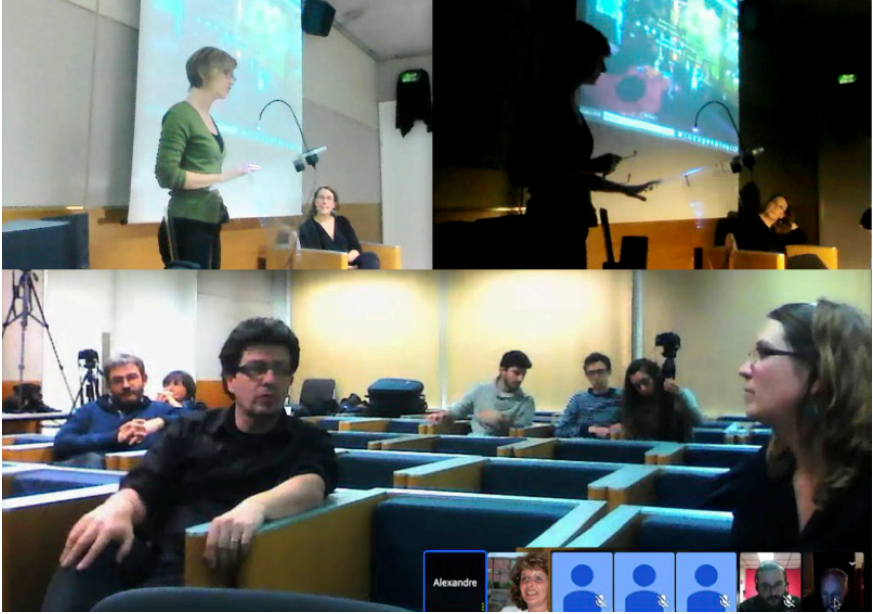
Figure 3. Moments de répétition, de jeu et d'échanges via Hang Out