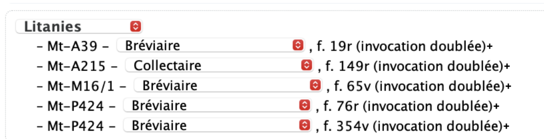
FIGURE 11 – Environnement pour ajouter une autre source liturgique

Pour ajouter une nouvelle source liturgique, il clique sur le bouton + à la fin d'une référence (élément <bibl> ).