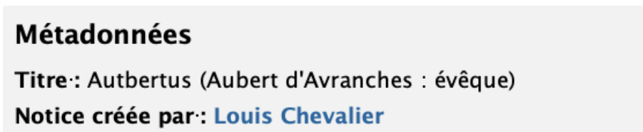
FIGURE 3 – Environnement pour renseigner les métadonnées de la fiche

Les informations constituant les éléments <publicationStmt> et <sourceDesc> sont déjà présentes lors de la création de la notice ; elles ne sont pas visibles depuis la feuille de style.