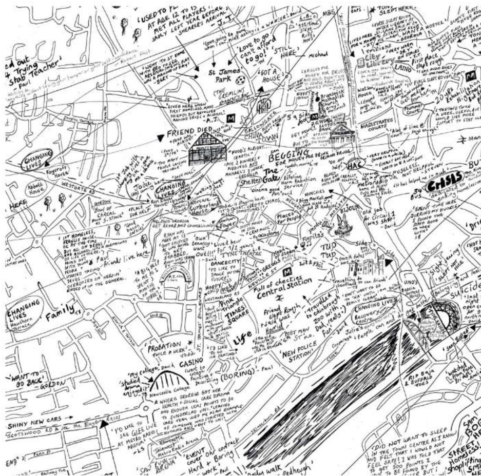
Carte « Spaces of Homelessness » par Lovely Jojo.

Des chercheurs de la ville de Newcastle au Royaume-Uni ont organisés 6 ateliers de contre-cartographie avec 30 personnes vivant dans la rue ou hébergées dans des logements accompagnés. Un fond de carte vierge de la ville était présenté aux participants qui devaient écrire dessus des événements de leur vie et des expériences de leurs quotidiens situés sur la carte. Cela permettait de montrer la diversité du vécu des sans-abris dans la ville. L'outil cartographique a notamment permis aux participants de s'approprier facilement l'atelier.