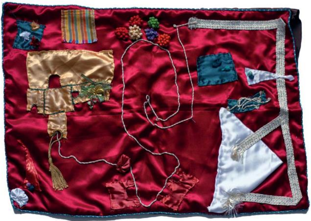
Cartographie textile de Sidi Yusuf. Naïma S., Hanane Hafid, Elise Olmedo, 2014.

Issu d'un travail de recherche au Maroc entre 2010 et 2016 le but de cette cartographie atypique était de restituer les espaces pratiqués et vécus par les femmes d'un quartier populaire. Le travail à partir d'un support textile cherchait à approcher la complexité sensible des espaces. Les personnes ont ainsi réalisé la carte en brodant et cousant, mobilisant un savoir traditionnel et en s'interrogeant sur la manière dont elles souhaitaient représenter leurs vécus. Ce qui a également faciliter l'appropriation de ces cartes par d'autres personnes qui pouvait autant les regarder, que les toucher ou les compléter.