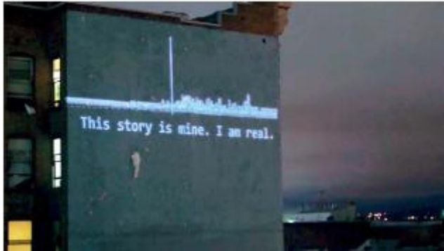
Exemple de projection d'une histoire orale sur la façade d'un bâtiment - Source : Ceci n'est pas un atlas

Porté par un collectif documentant la gentrification dans la baie de San-Francisco, le projet Cartographie Anti-éviiction vise à réaliser des visuels concernant les départs forcés et à les mettre en récit pour mieux les diffuser. Le collectif associe notamment aux cartes d'autres supports, par exemple des histoires orales des victimes d'éviiction, mettant parfois en lumière les violences racistes à l'œuvre, qui ne sont pas visible avec la carte seule. Ces récits oraux ont notamment été projetés sur des façades de bâtiments de San Francisco.