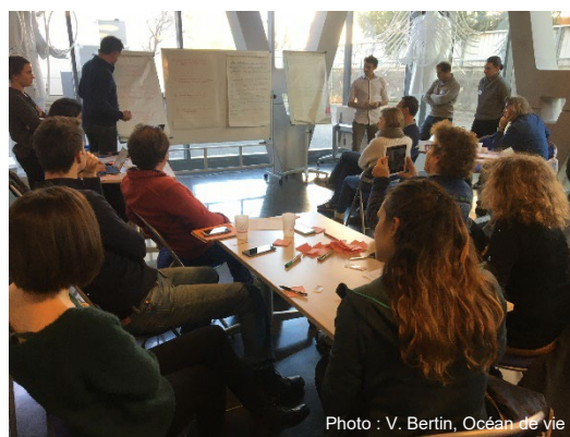
Figure 1 – Premier atelier, décembre 2019

Pour établir un plan d'action, lors du second atelier, les participants ont été invités à se projeter et identifier les éléments qui favoriseraient la réussite d'un projet idéal. La réflexion s'est ensuite tournée sur les premiers "petit pas" à mettre en œuvre de manière concrète et accessible et d'identifier les acteurs et les moyens (matériels, humains, financiers, méthodologiques) à engager.