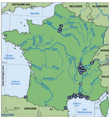
Figure 3 – Carte de répartition des participants du 2 nd atelier co-élaborée en ligne, sur l'outil Mural

Les objectifs mis en avant par les participants étaient d'une part, d'harmoniser les protocoles pour cibler les zones sources et d'accumulation et d'autre part, d'engager producteurs et consommateurs dans l'action afin de faire évoluer les comportements et la réglementation. Il s'agit d'éviter les approches culpabilisantes et, au contraire, de favoriser celles qui invitent à faire ensemble, à co-construire et participer en bénéficiant des moyens tous les acteurs ciblés : citoyens, chercheurs, industriels, décideurs, élus, syndicats... Les groupes de travail ont identifié des contraintes pour les atteindre, comme les coûts (e.g., des méthodologies à mettre en œuvre, des produits moins polluants), le temps dont chacun dispose. Ils ont souligné aussi qu'il est nécessaire que les citoyens se mélangent quelle que soit leurs origines et expertises. Ils ont ensuite listé plusieurs moyens pour contrer ces contraintes, comme des outils de partage (e.g., plateforme, applications Android), des dispositifs d'envergure déjà en place au sein des collectivités ou des réseaux d'observation (e.g., stations de sédimentation, barrages, voiries), la formation d'ambassadeurs ou la possibilité de mener des campagnes de sensibilisation/éducation. En ce sens, le Rhône bénéficie du Plan Rhône/Saône qui peut faciliter la coordination d'un projet de grande envergure sur tout son continuum.