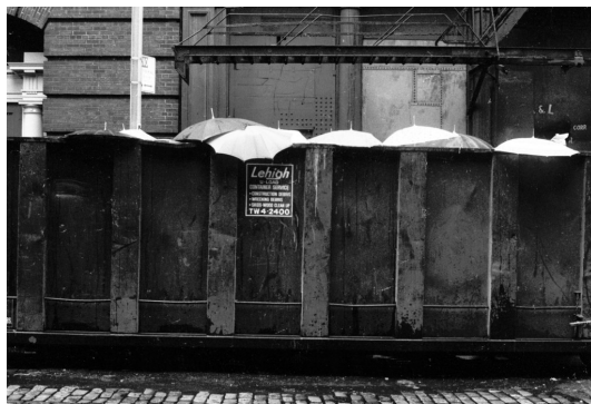
Open House (Also Called Drag-On & Dumpster), 1972. Wood, Found Doors, Industrial Container

Particularly fertile, in this sense, was the period of the '70s, which saw the emergence of the atypical figure of Gordon Matta-Clark, an architect/artist from New York, engaged in the search for a