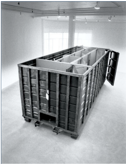
Open House (Also Called Drag-On & Dumpster), 1972. Wood, Found Doors, Industrial Container

« (...)Les préoccupations relatives à l'écologie focalisent désormais l'attention sur la précarité des milieux de vie conduisant à explorer les entrelacs de l'artefact avec les dynamiques tectoniques et biologiques plutôt qu'à poursuivre des volontés prométhéennes. Des postures de ruse s'élaborent pour s'allier à la nature en tant que puissance dynamique. Ce changement interpelle les fondations que l'architecture contribue à instaurer et les régénérations qu'elle peut susciter.» (Chris Younès)