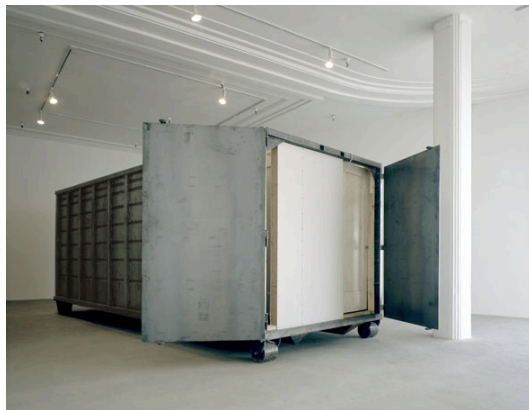
Open House (Also Called Drag-On & Dumpster), 1972. Wood, Found Doors, Industrial Container

tematica non è certo nuova nell'alveo della cultura architettonica, già alla fine degli anni '50 Giancarlo De Carlo incarnava in Italia la figura di architetto-educatore, come ruolo edificante di mediazione tra progetto e pubblico-fruitori. E' utile precisare che, al contempo, anche l'idea di sviluppo sostenibile si è modificata, in parallelo e nel corso degli anni, dando sempre maggior peso ai valori relazionali, alle politiche che organizzano le relazioni sociali all'interno delle dinamiche urbane.