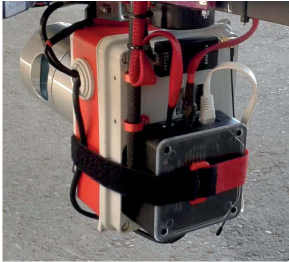
Fig. 2 : Carte Odroid C2 et son boîtier de protection