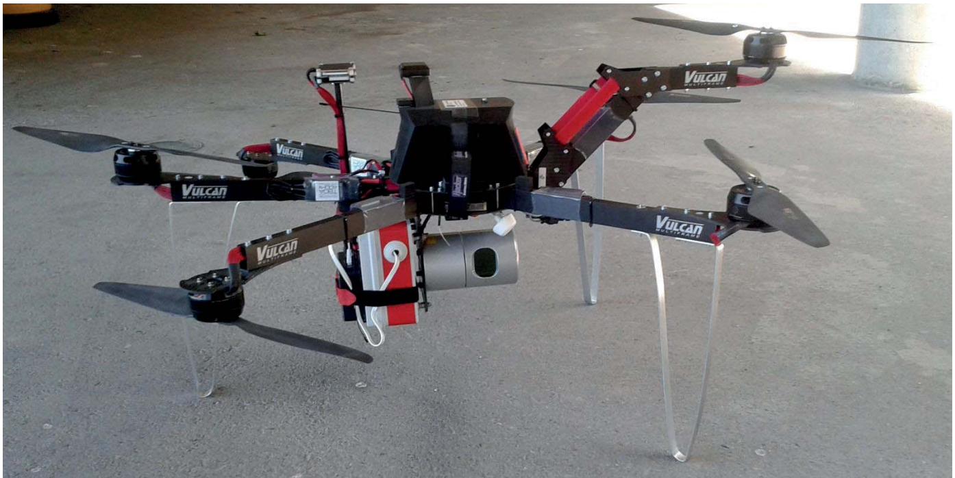
Fig. 3 : Plateforme LiDAR / Drone

L'ensemble de ces développements technologiques et informatiques ont abouti à la mise en place de cette plateforme drone LiDAR qui est dorénavant opérationnelle (fig. 3). Cette solution matérielle sera utilisée sur le site de Péage-de-Roussillon dans le cadre du suivi de la restauration de l'île des Gravieres dans la réserve naturelle de la Platière.