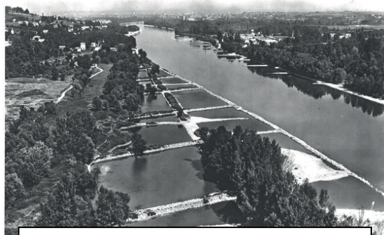
Fig. 1 : Casier Girardon du Rhône.

Une des priorités de l'OHM Vallée du Rhône est d'étudier les marges construites comme modèle d'exploration de la notion d'anthropo-construction. Parmi ces constructions, les aménagements Girardon réalisés au cours du XIX ème siècle visaient à augmenter la navigabilité du fleuve (Fig. 1) en figeant un chenal de navigation latéralement et verticalement, en piégeant les MES et en limitant l'érosion des marges.