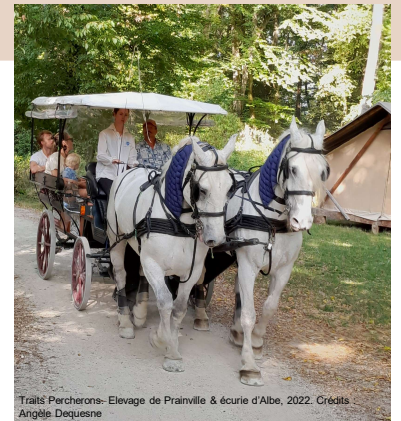
Traits Percherons. Elevage de Prainville & écurie d'Albe, 2022.