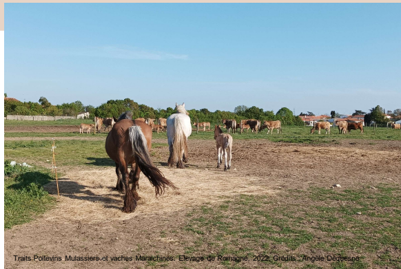
Traits Poitevins Mulassiers et vaches Marchandes. Elevage de Romagné, 2022.

→ Travailler avec pour vivre avec, et vivre mieux en vivant ensemble