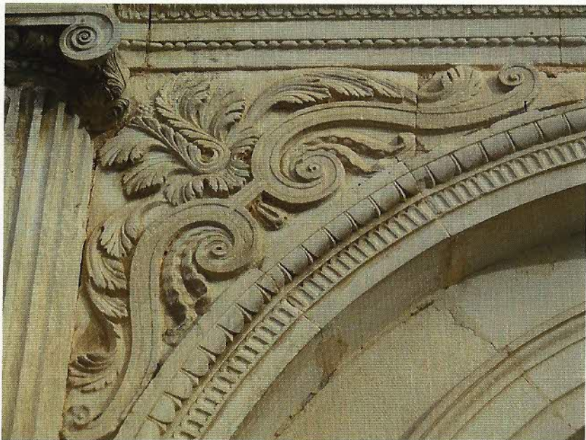
FIG. 3 – Troisième arche en partant de la gauche : acanthes.