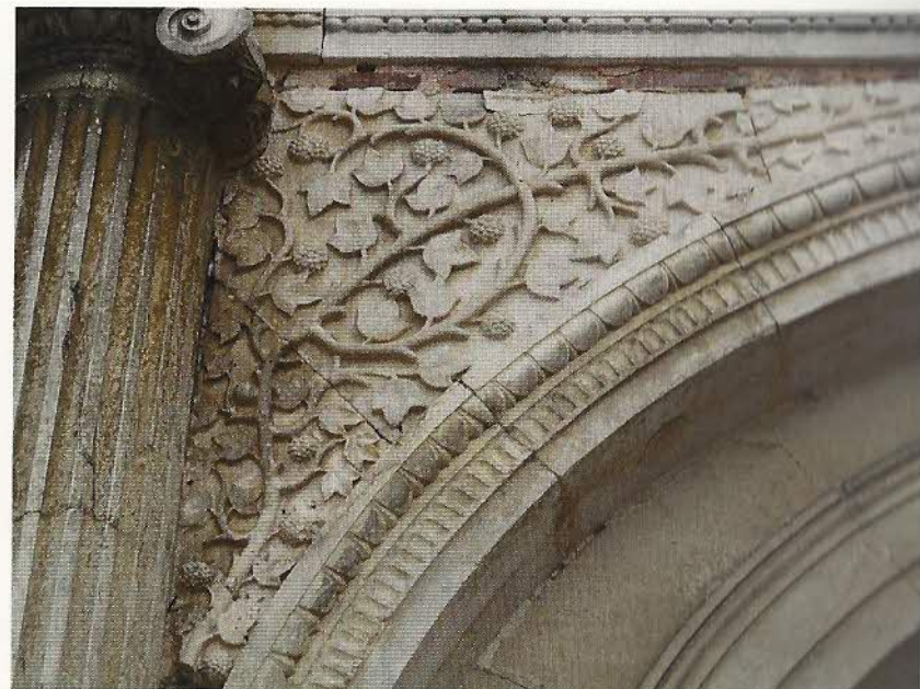
FIG. 5 – Cinquième arche en partant de la gauche : lierre.