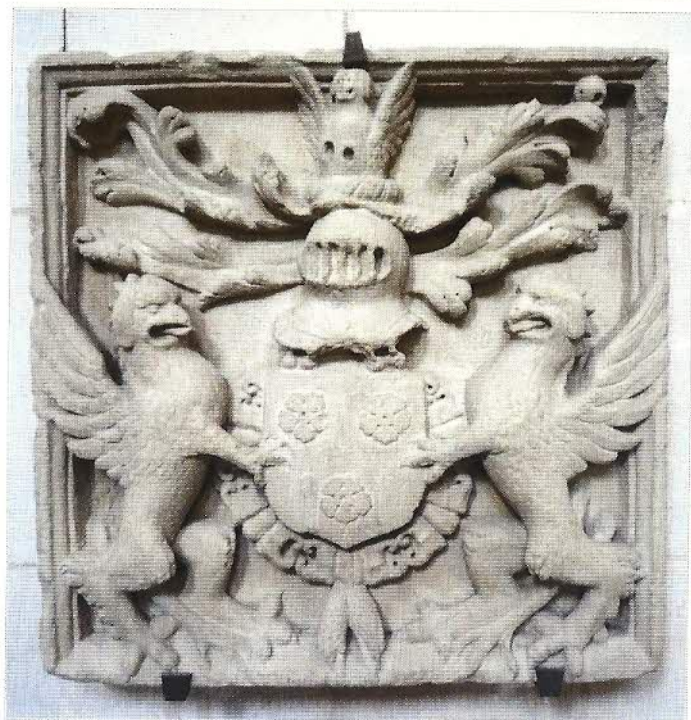
FIG. 8 – Bas-relief aux armes des Vergy.