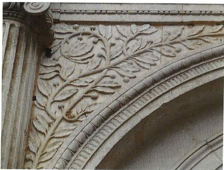
FIG. 7 (ci-dessus) – Septième arche en partant de la gauche : laurier.