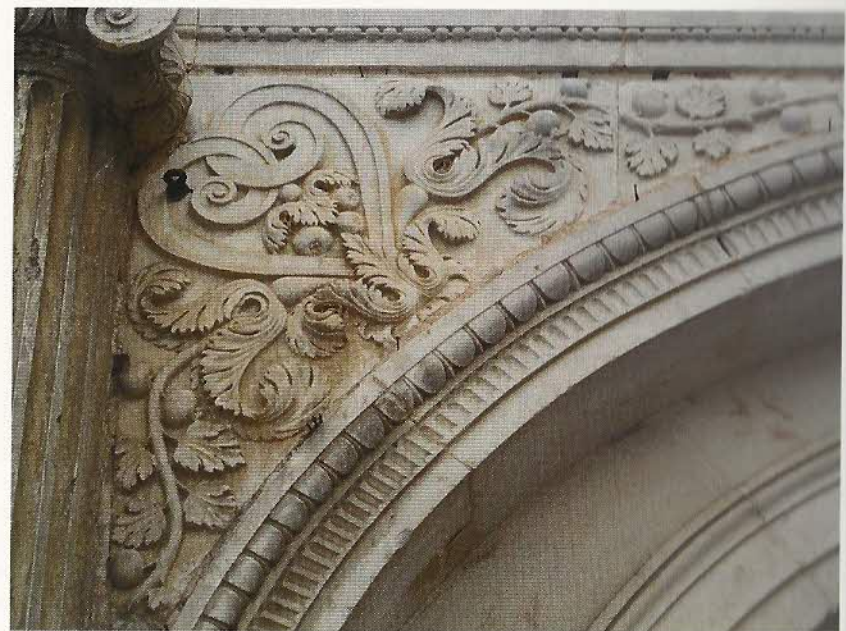
FIG. 6 – Sixième arche en partant de la gauche : grenades et acanthes.