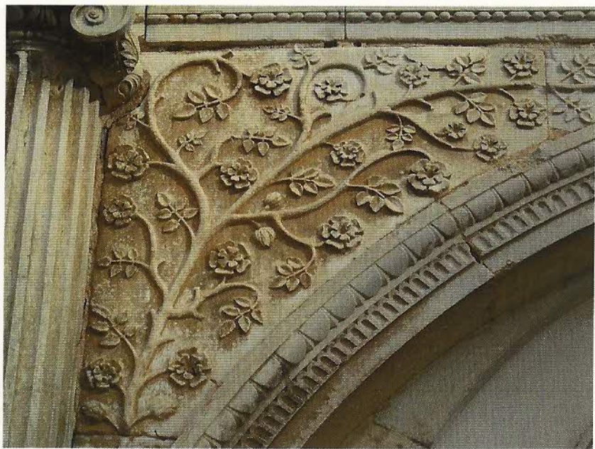
FIG. 4 – Arche centrale (portail) : rosier.