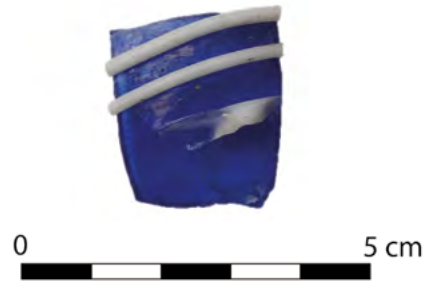
Fig. 1 Fragment de verre bleu à décor de filets blancs opaques découvert au château de Moha

Parmi les éléments découverts dans cette strate détritique se trouve également un fragment de verre bleu à décor de filets blancs opaques (fig. 1). Cet objet appartient à un large groupe de vaisselles en verre