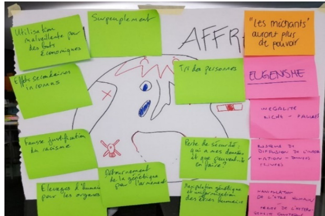
Figure 3. Le monde affreux (forum II, 17 janvier 2019).

La génétisation de nos vies est associée dans le monde merveilleux à la figure idéale de l'« homo geneticus » (Aceti et al., 2020), qui bénéficie d'une meilleure prévention, d'une prise en charge précoce et des soins efficaces jusqu'à l'éradication progressive des maladies génétiques. Cependant, cette jeune femme associe ces paramètres au monde de l'enfer, car la sélection génétique conduirait selon elle à la « déshumanisation » de notre société. Le concept de génétisme et la perspective des inégalités sociales sont également exprimés dans le propos de cet autre citoyen : « [...] un monde beaucoup plus individualiste qu'aujourd'hui, où tout serait segmenté. Donc les bons génomes d'un côté et les pourris de l'autre. Hop et voilà! Ce serait un monde, voilà, réellement classé selon ça. »