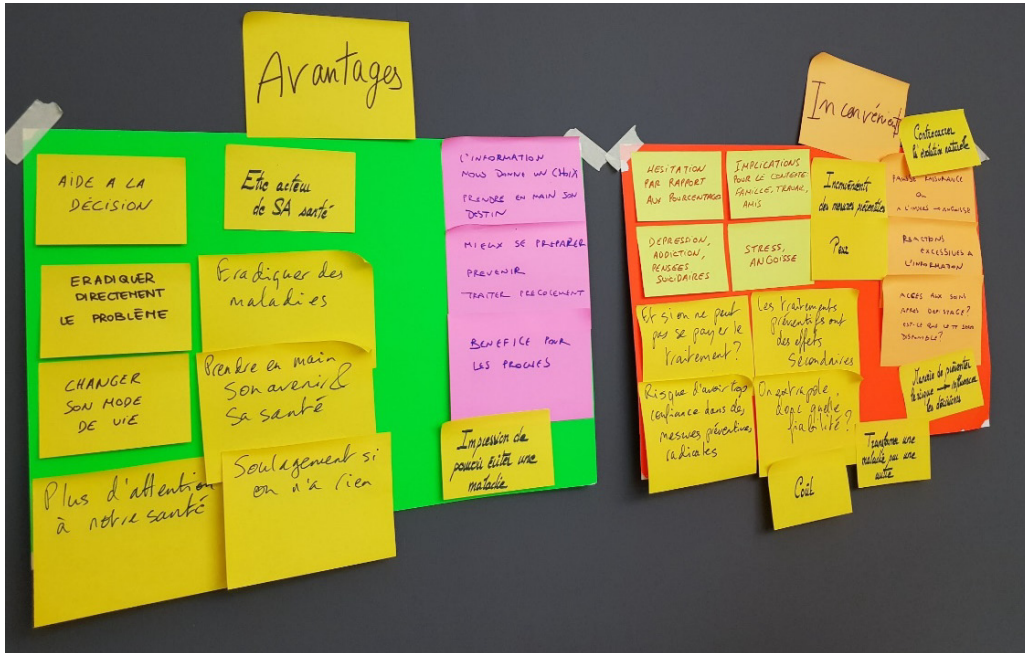
Figure 1. Les tests génétiques (forum IV, 26 février 2019).