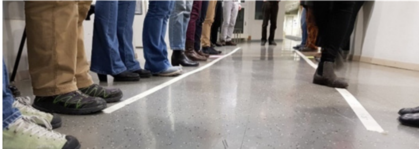
Figure 4. Activité de « positionnement » (forum II, 17 janvier 2019).

« l'importance de se remettre en question sur des sujets pour lesquels on a tendance à faire l'impasse tant que l'on ne se sent pas concerné ». On remarque l'importance donnée aux interactions qui se construisent dans un mouvement collectif et dynamique grâce aux échanges d'idées et aux « discussions intéressantes avec [des] personnes intéressantes ». Au-delà de la délibération, les conversations amènent à clarifier ses propres arguments : « [...] les contributions de mes voisins de table m'ont permis de réfléchir davantage et de mieux préciser mes positions. » Les bénéfices du « contact avec les autres participants » sont aussi valorisés de même que « les aspects positifs et négatifs imbriqués » amenant cette participante à qualifier cette expérience de « véritable thérapie de l'esprit » et une autre à dire que « l'échange devient infini, car il s'enrichit ». La situation d'apprentissage horizontal (« entre pairs ») est perçue comme d'autant plus efficace :