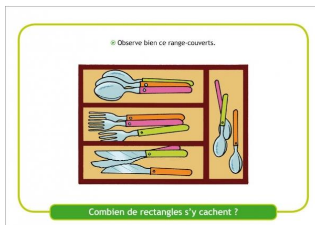
Fig. 3 : Anticipation AD : tâche 2 (extrait de Enig'maths)