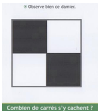
Fig. 2 : Anticipation AD : tâche 1 (extrait de Enig'maths)

Afin d'anticiper le travail à réaliser lors du co-enseignement, l'enseignante B propose à AD les deux tâches illustrées par les Figures 2 et 3. Les tâches proposées à AM sont illustrées par les Figures 4 et 5.