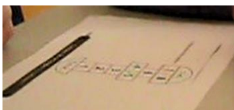
Fig. 5 : Anticipation AM : tâche 2 (Combien y a-t-il de rectangles ?)

Il s'agit de problèmes ouverts mettant en jeu un dénombrement. En effet, l'élève dispose d'une figure complexe et doit dénombrer l'ensemble des carrés, rectangles ou triangles composant la figure. Ces tâches nécessitent également un changement de regard sur les figures (Duval & Godin, 2005). En effet, les sous-figures sont facilement identifiables mais il faut ensuite dépasser ce premier regard pour repérer les figures pouvant être obtenues par assemblage par juxtaposition des sous-figures de base.