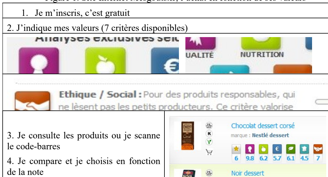
Figure 1. Site Internet Mesgouts.fr, l'achat en fonction de ses valeurs

En 2016, quelque 7000 consommateurs français ont activement participé à la co-construction d'une filière laitière guidée par un objectif social. Il s'est agi d'améliorer les conditions de vie