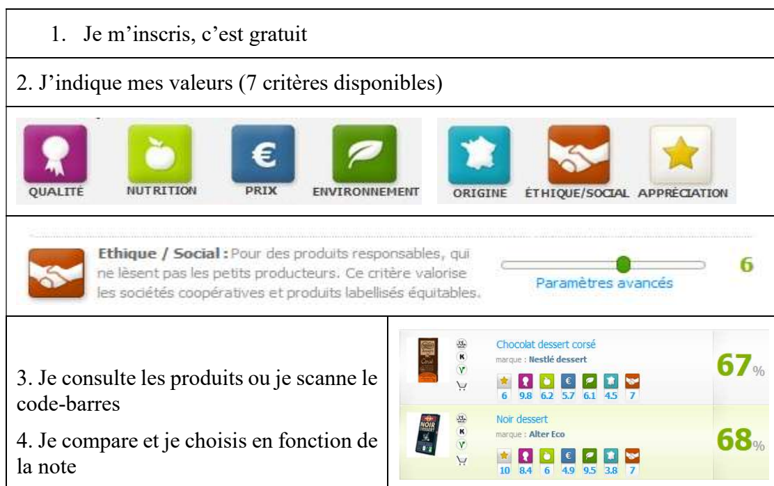
Figure n°2 : Site Internet Mesgouts.fr , l'achat en fonction de ses valeurs