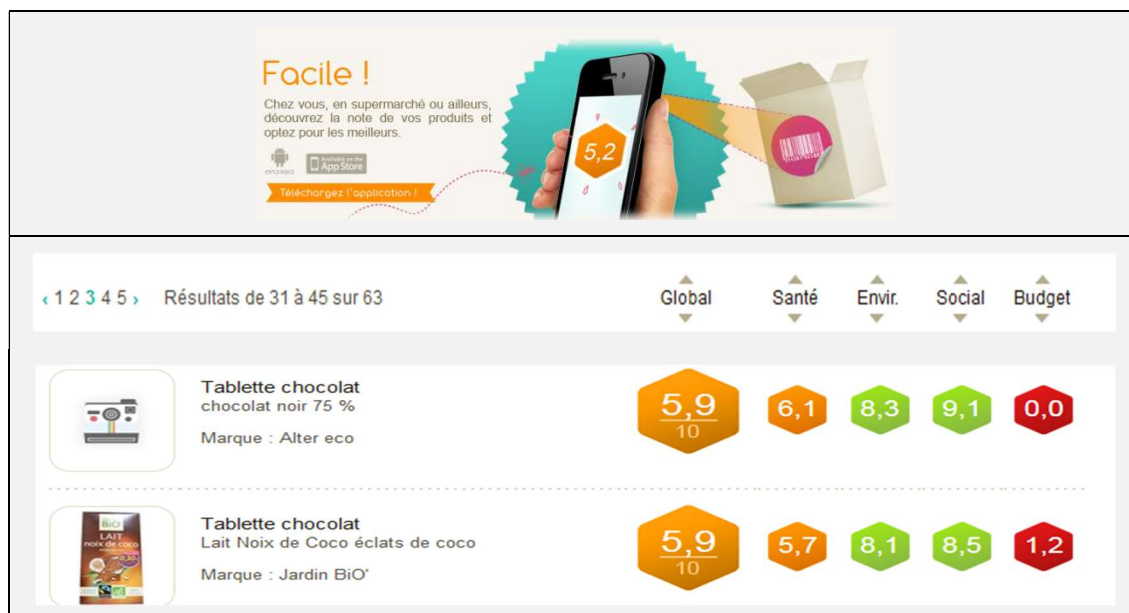
Figure n°1 : Extrait Application Notoo, information sur l'acte d'achat, l'exemple du chocolat