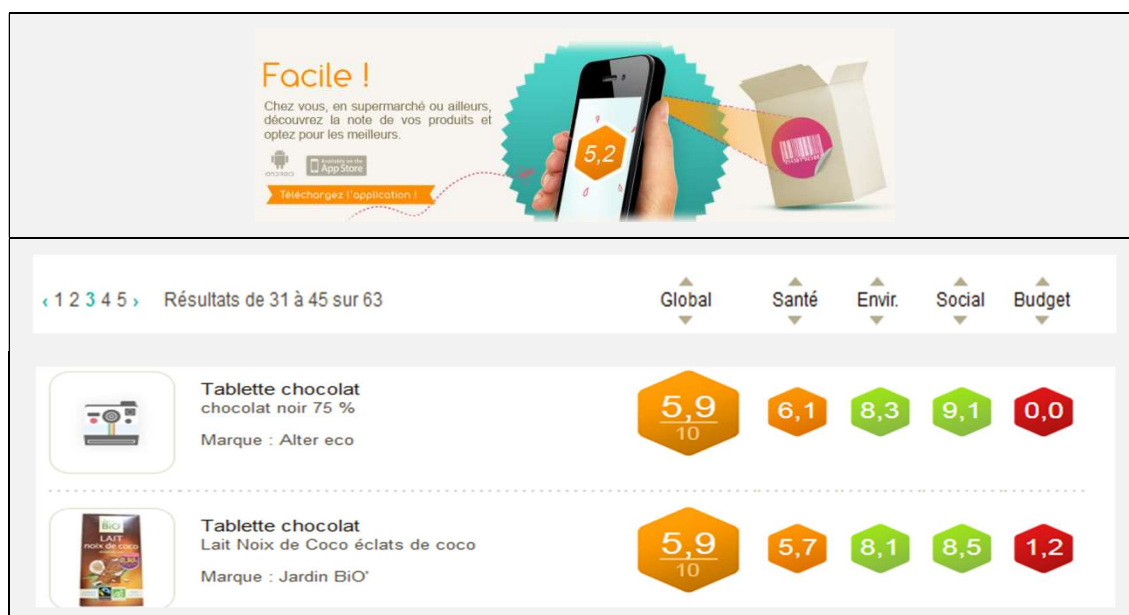
Figure n°1 : Extrait Application Noteo, information sur l'acte d'achat, l'exemple du chocolat