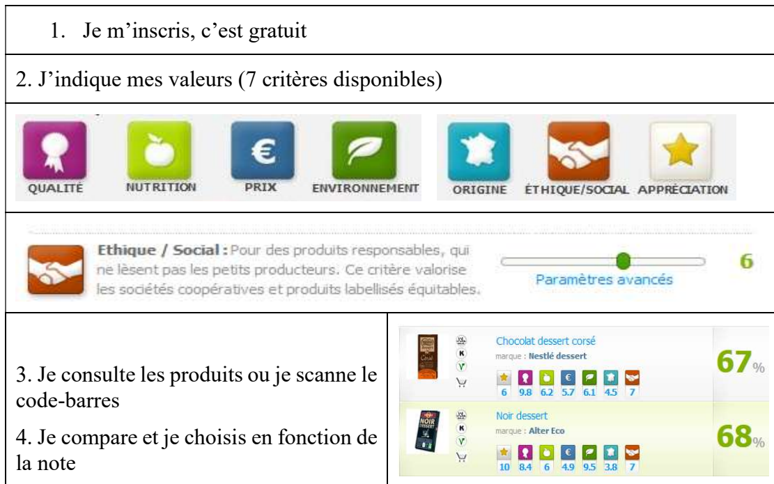
Figure n°2 : Site Internet Mesgouts.fr , l'achat en fonction de ses valeurs