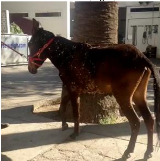
Figure 2 : Attitude du mulet à l'admission, il ne pose pas le MAD sur le sol au repos comme en mouvement.

Le mulet a une note d'état corporel de 3/5 avec un poids de 187 kg à la pesée. Il est abattu avec une suppression d'appui du membre antérieur droit ( Fig. 2 ).