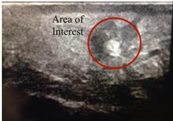
Figure 3 : Aspect échographique en regard d'un gonflement en face palmaire du paturon. Le cercle rouge indique une suspicion de corps étranger.

Pour vérifier l'intégrité des structures tendineuses et ligamentaires de cette zone, un examen échographique de la face palmaire médiale de l'articulation du paturon et de la gaine du tendon est réalisé. Nous constatons en regard de la plaie une zone circulaire aux contours définis et hyperéchogène localisée dans la couche sous-cutanée ( Fig. 3 ) et un épaississement tissulaire de cette région. Un diagnostic différentiel de processus inflammatoire, d'abcès et/ou de corps étranger est posé. L'examen de la gaine tendineuse est dans la normale.