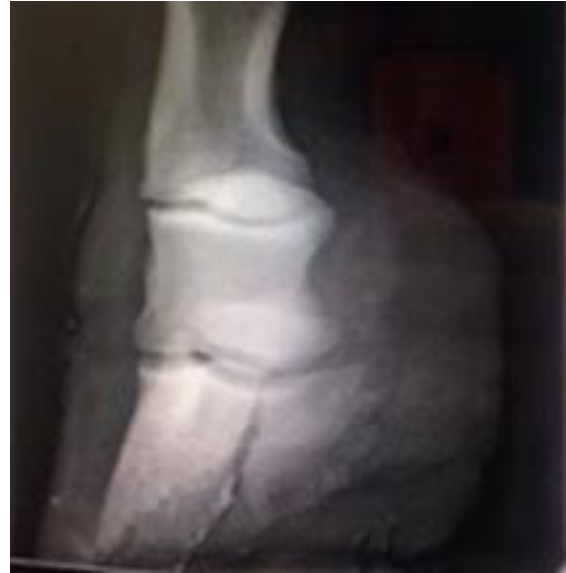
Figure 4 : vue oblique dorso-palmaire, latero-médiale du pied MAD.

uniquement visible sur une projection oblique dorso-palmaire, latero-médiale ( Fig. 4 ). Un diagnostic de fracture simple, articulaire et non déplacée de type II est établi.