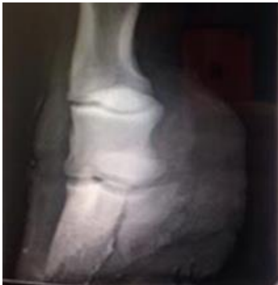
Figure 4: vue oblique dorso-palmaire, latero-médiale du pied MAD.

Un examen radiographique complet du pied MAD révèle une fracture de P3 uniquement visible sur une projection oblique dorso-palmaire, latero-médiale ( Fig. 4 ). Un diagnostic de fracture simple, articulaire et non déplacée de type II est établi