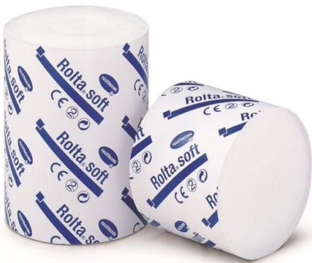
Figure 5: bande d'ouate Rolta soft utilisée pour le bandage

Les abords de la plaie sont tondués puis nettoyés avec de la chlorhexidine à 0,05% et une solution de chlorure de sodium à 0,9 %. Un morceau de métal d'environ 3 cm est retiré de la plaie. Un débridement chirurgical est ensuite réalisé à l'aide d'un bistouri avec une lame N°23 avant d'appliquer un bandage. Celui-ci est composé d'un pansement non-adhérent (Telfa) placé sur la plaie qui est ensuite recouvert d'une bande d'ouate Rolta soft de marque de HARTMANN ( Fig. 5 ) le tout fixé par une bande cohésive (Vetrap). Une chaussure à rebord de taille T1 (largeur 133 x longueur 126 mm) est placée par-dessus. Cette dernière agit comme un moule de la paroi du sabot pour réduire les mouvements au niveau du site de fracture de P3.