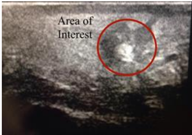
Figure 3: Aspect échographique en regard d'un gonflement en face palmaire du paturon. Le cercle rouge indique une suspicion de corps étranger.