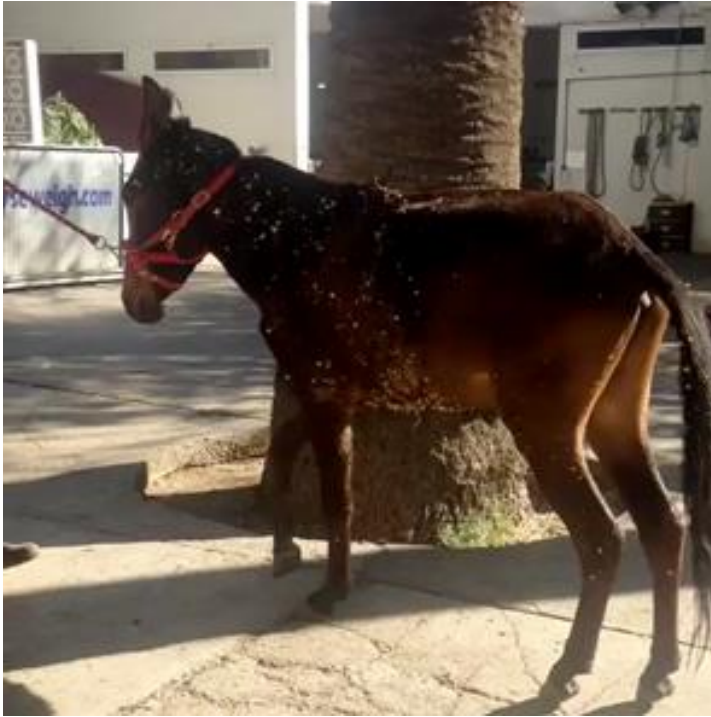
Figure 2: Attitude du mulet à l'admission, il ne pose pas le MAD sur le sol au repos comme en mouvement.