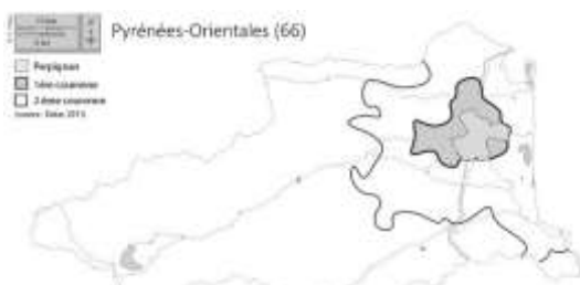
Figure 1 : présentation du terrain d'enquête

Toutefois, avant de présenter plus en détails d'autres cas de PSH étudiés, je souhaite revenir sur ce qui est envisagé comme un biais possible dans ce travail : celui d'opposer