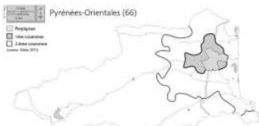
Figure 1 : présentation du terrain d'enquête

Toutefois, avant de présenter plus en détails d'autres cas de PSH étudiés, je souhaite revenir sur ce qui est envisagé comme un biais possible dans ce travail : celui d'opposer