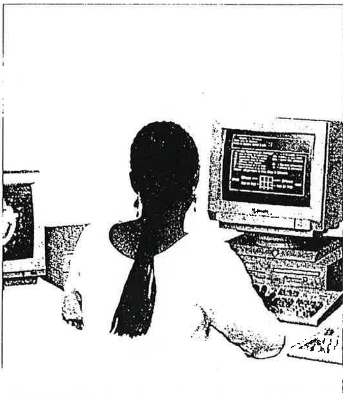
Renforcer l'image du français comme langue de la modernité.

Au sommet francophone de Cotonou, les différents chefs d'État vont tracer les grands axes de la future politique de l'espace francophone, la politique linguistique en est une composante essentielle. L'auteur du présent article a participé à la rédaction du livre blanc que l'AUFELF* a consacré à son programme d'action pour les deux ans à venir.