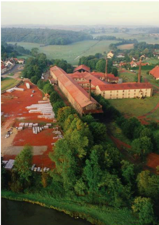
Figure 1. Vue aérienne de la tuilerie de Grossouvre, décennie 1990