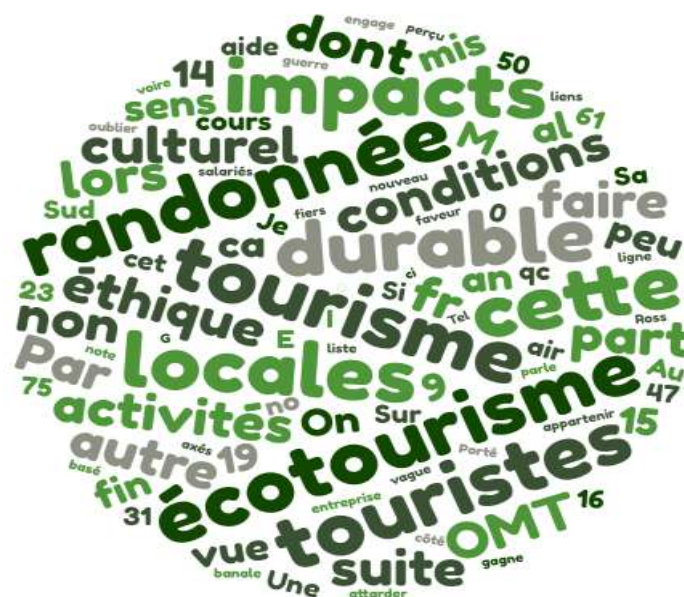
Figure n° 2 : Nuage des mots des questions ouvertes