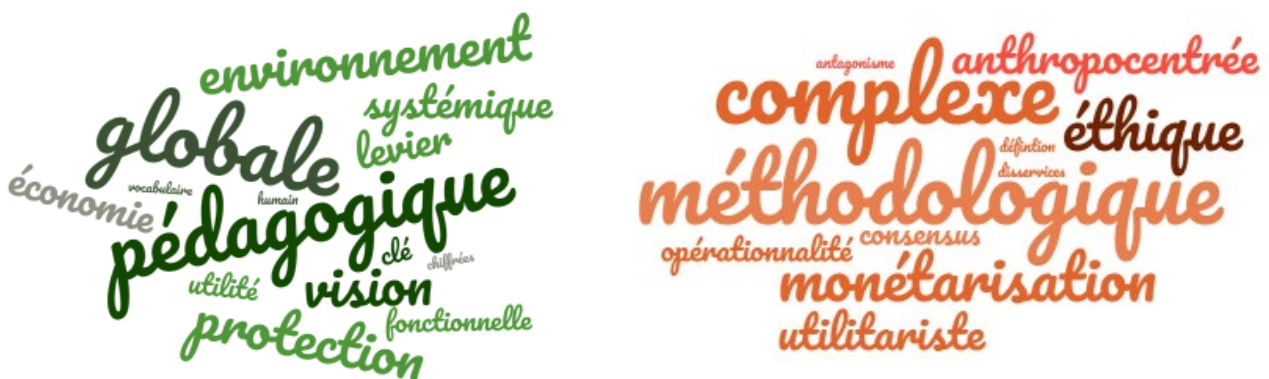
Figure 2 - Nuage de mots illustrant les apports (en vert) et limites (orange) de la notion de services écosystémiques évoqués lors des entretiens.

Les principaux apports cités en faveur de l'utilisation des SES sont le côté pédagogique, la justification d'une protection de l'environnement par la démonstration de son utilité et une vision globale donnée à l'écosystème ( Figure 2 ). Les limites sont la difficulté méthodologique, la complexité de l'approche et les considérations éthiques qui la sous-tendent (anthropocentrisme, monétarisation même si elle n'est pas une obligation, ...). Là encore, la formation initiale joue sur les points de vue des acteurs.