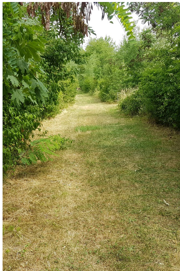
© Daniel Florentin - Plateau de Haye - Nancy

Le deuxième porte sur l'outil d'Analyse de Cycle de Vie (ACV) à l'échelle du quartier. Ce type de démarche cherche à mesurer, en phase de conception, les impacts environnementaux variés d'une opération d'aménagement. Dans le cadre d'un financement du programme ANRU+, une collectivité francilienne s'est saisie de l'outil sur une de ses opérations de rénovation urbaine depuis 2018 pour essayer de rendre son projet plus sobre matériellement et vertueux écologiquement. L'outil d'ACV a permis de qualifier plus finement les impacts de décision de démolition ou de réhabilitation de certains ensembles. Toutefois, il n'a que peu été approprié par l'aménageur, est parfois réduit à sa simple composante carbone (ou énergétique) et sert finalement moins d'outil de cadrage d'un projet que de plateforme de négociation entre la collectivité, l'aménageur et la maîtrise d'œuvre. Il porte malgré tout un potentiel pour une meilleure connaissance environnementale des effets d'une opération et peut devenir un outil précieux d'aide à la décision dès la conception, à la condition de faire l'objet d'un accompagnement précis sur ses capacités et son rôle. Il n'efface en rien la décision politique, mais doit permettre de l'éclairer par des outils et des métriques non financières. En d'autres termes, il permet de prendre en compte, de compter, de rendre compte et laisse ouvert la question de qui en est comptable.