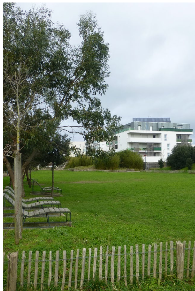
Quartier Certé à Trignac (Loire Atlantique)

Tous ces éléments dessinent les amorces d'une comptabilité écologique pour prendre en compte, compter, être comptable et rendre compte. Pour aller plus loin dans la démarche, l'équipe de recherche travaille avec les aménageurs à la construction d'outils écologisés de pilotage d'opérations, et notamment à l'expérimentation de bilans écologiques d'opérations, qui viendraient compléter ou se substituer aux bilans actuels. Trois démarches sont en cours d'expérimentation, le bilan d'aménageur coloré (qui vise à classer les dépenses selon leur caractère écologique plus ou moins vertueux), le bilan en grandeurs physiques exclusivement (qui vise à cartographier l'impact matériel d'une opération) et le bilan intégrant les coûts de maintien ou de restauration des écosystèmes (qui vise à qualifier de manière dynamique les coûts associés au maintien ou à l'atteinte de la bonne santé des écosystèmes sur le territoire d'une opération).