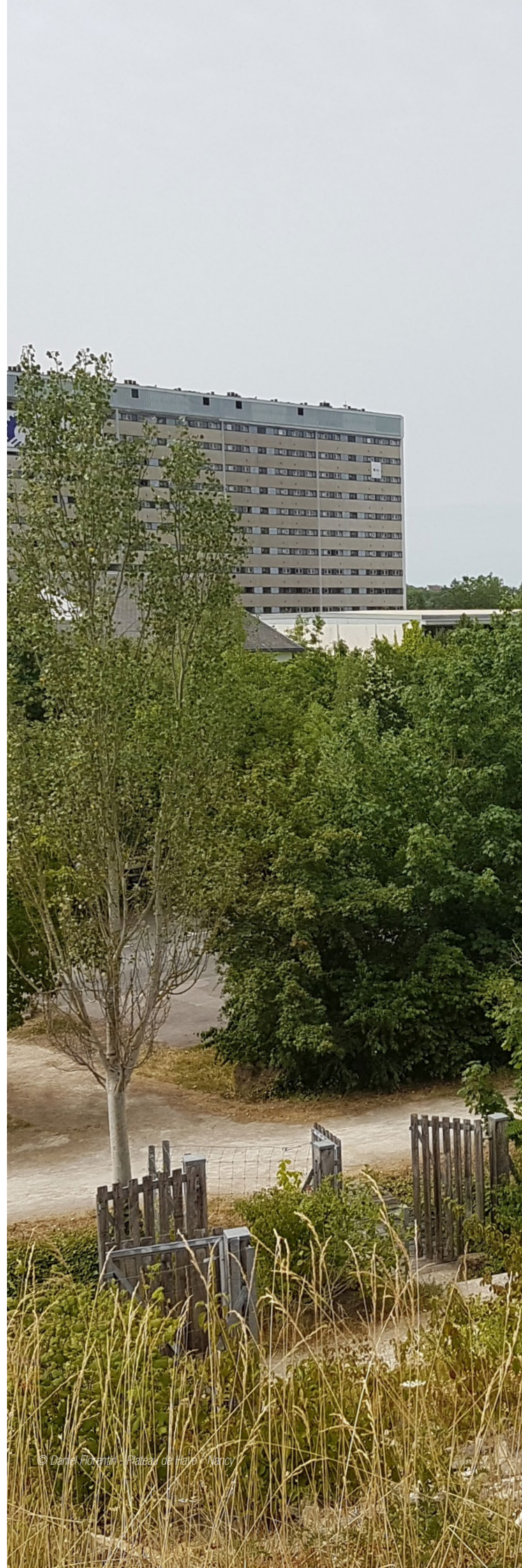
© Daniel Florentin - Plateau de Hainé - Nancy