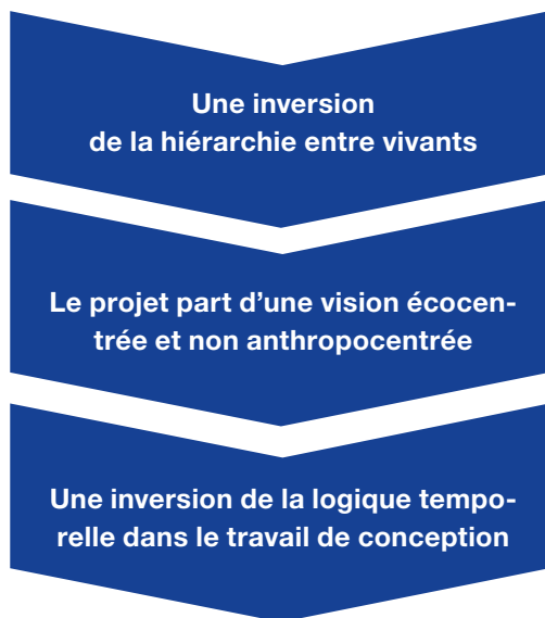
La prise en compte de l'empreinte biodiversité conduit à une inversion de la conduite de projet habituelle