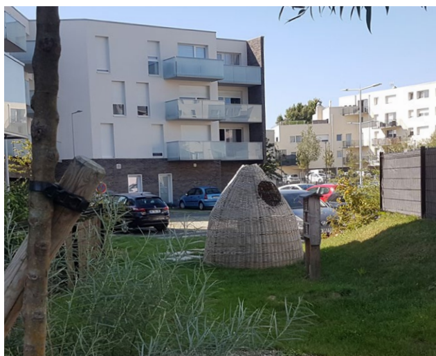
© Daniel Florentin - Quartier de l'Hippodrome Wattrelos

Les travaux classiques d'économie de l'aménagement considèrent que l'acte d'aménager repose sur le principe que la ville paie la ville, via notamment la revente de charges foncières. Mais, qu'il s'agisse du recours à des matériaux biosourcés, de la baisse de la surface de plancher pour augmenter la taille des espaces verts ou préserver des milieux naturels, de la réhabilitation d'un bâtiment plutôt que sa démolition/reconstruction, ces pratiques participant à l'écologisation de l'aménagement modifient les équilibres financiers des projets urbains. Elles génèrent des coûts nouveaux, souvent perçus comme des surcoûts par rapport aux pratiques habituelles. Qui porte ces coûts ? Doivent-ils être pris en charge par les collectivités territoriales, dont les ressources budgétaires sont limitées, par l'État et ses agences, ou par les promoteurs privés, au risque de les reporter sur les usagers finaux des constructions et donc d'accroître la segmentation sociale de l'habitat et les