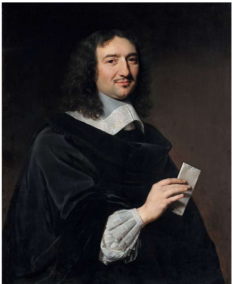
Jean-Baptiste Colbert, par Philippe de Champaigne (1655).