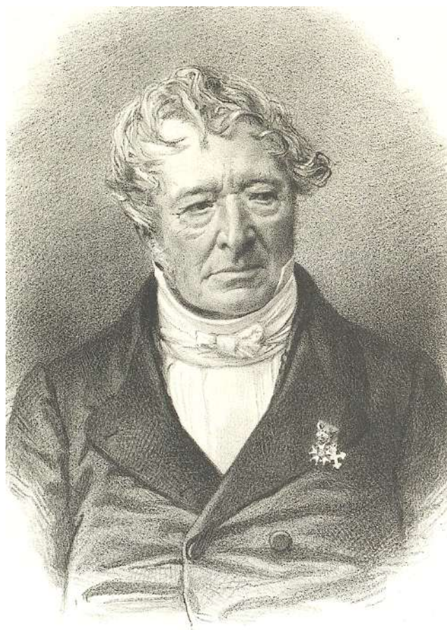
Jacques-Joseph Champollion-Figeac (après 1866), artiste inconnu.

Ce n'était pas là le dernier livre de l'abbé Louis-Alexandre Pougeois puisque plus d'un foyer morétain conserve dans sa bibliothèque (ou son grenier) l'une ou