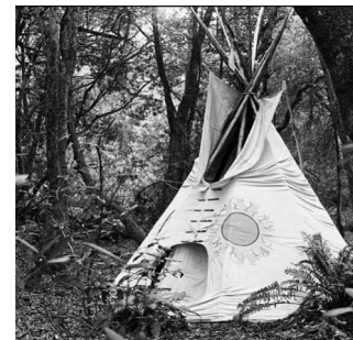
Figure 3. Abris individuels