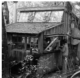
Figure 3. Abri individuel - cuisine commune