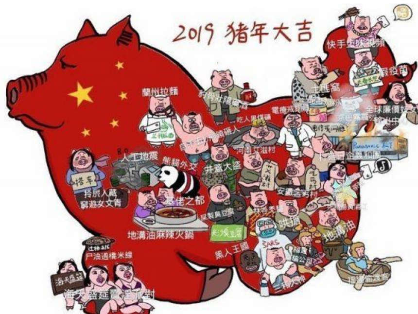
1. Zhang Dongning 張冬宁, Carte de vœux 2019 (année du Cochon).

Zhang Dongning a dessiné une carte de Chine sous l'aspect d'un gros cochon rouge, couché, sur lequel apparaissent des personnages à tête de cochon et pieds de cochons, féminins et masculins (ill. 1).