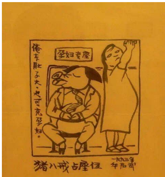
8. Hua Junwu (1915-2010), Zhu Bajie s'assoit à la place réservée aux femmes enceintes (sous le prétexte que lui aussi a un gros ventre) , encre sur papier, 1993, Shanghai, China Art Museum.