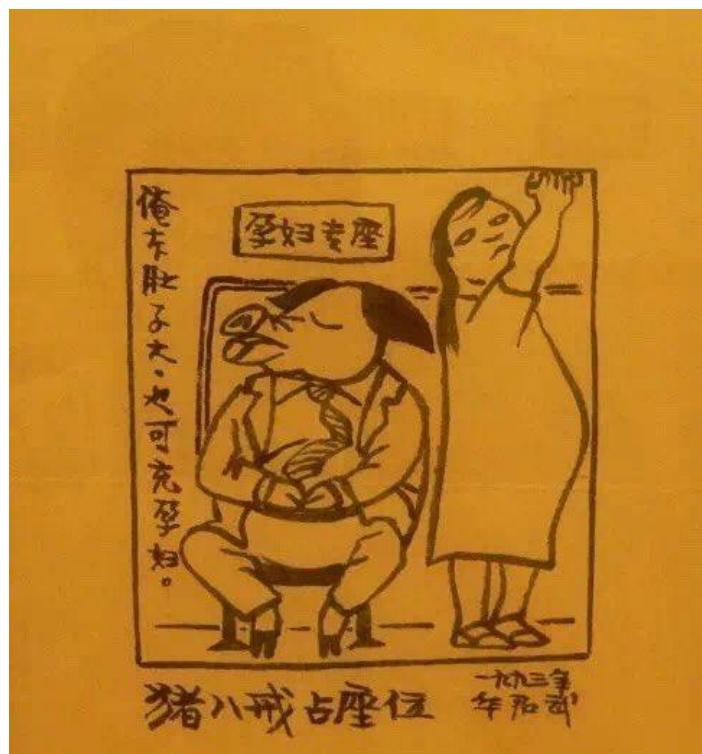
8. Hua Junwu (1915-2010), Zhu Bajie s'assoit à la place réservée aux femmes enceintes (sous le prétexte que lui aussi a un gros ventre) , encre sur papier, 1993, Shanghai, China Art Museum.