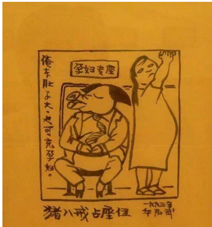
8. Hua Junwu (1915-2010), Zhu Bajie s'assoit à la place réservée aux femmes enceintes (sous le prétexte que lui aussi a un gros ventre) , encre sur papier, 1993, Shanghai, China Art Museum.