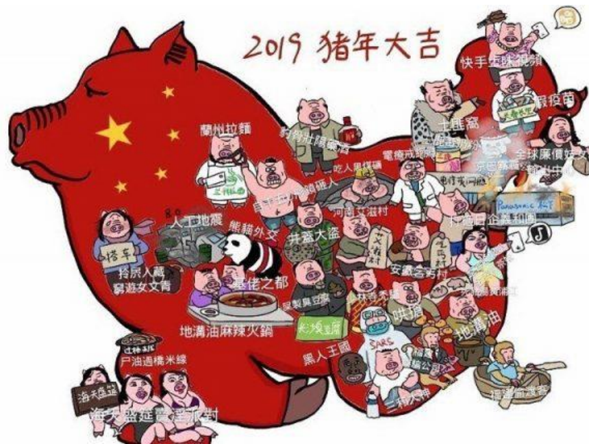
1. Zhang Dongning 張冬宁, Carte de vœux 2019 (année du Cochon).

Zhang Dongning a dessiné une carte de Chine sous l'aspect d'un gros cochon rouge, couché, sur lequel apparaissent des personnages à tête de cochon et pieds de cochons, féminins et masculins (ill. 1).